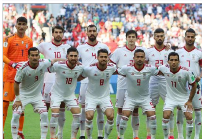
تیم ملی فوتبال ایران

اسکاتلند، یونان، مراکش، بلغارستان، آسکاتلند، یونان، مراکش، بلغارستان، جمهوری چک، نروژ، ژاپن و نیجریه همچنان تیم اول آسیاست.