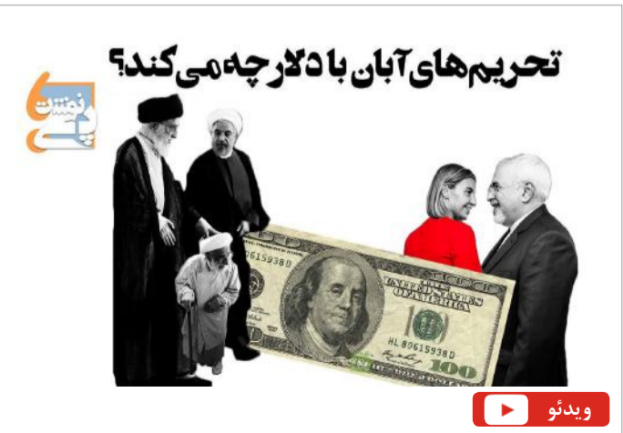
تحریم‌های آبان با دلار چه می‌کند؟

قرارگاه سایبری عمار وابسته به باند طائب‌ها در اطلاعات سپاه یک سخنرانی از پاسدار سعید قاسمی ملقب به «حاج سعید» از چماق‌بده‌های حزب‌الله را منتشر کرده که وی در آن خطاب به دولتی‌ها می‌گوید اتوبوس شما به سمت پر تگاه می‌رود و ما عُمرأ در آن بمانیم! او در بخشی از این سخنان گفته: «یک احمقی از اتوبان اتوبوس را برداشته تو جاده پُر از دست‌انداز میره می‌گه من ماینر بدم، از مسیر ارتباط با آمریکایی‌ها و اروپایی‌ها می‌خواد مارو به ساحل نجات برسونه، ما عُمرأ بخوایم با تو سقوط کنیم، ما داریم تهنش رو می‌بینیم قبل اینکه بخوای