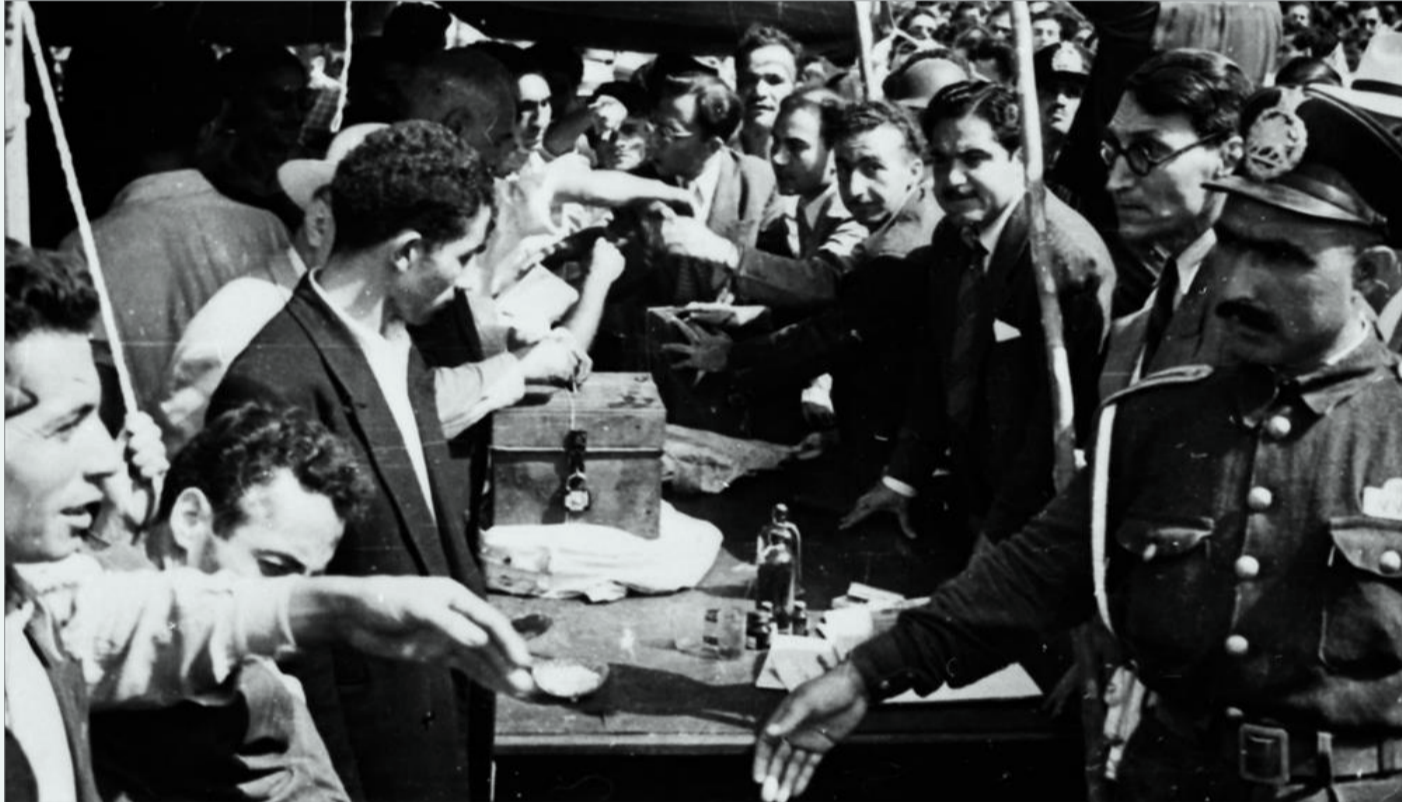
در فراندوم انحلال مجلس، برای مخالفین و موافقین صندوقهای جداگانه گذاشته بودند! این عکس، موافقین فراندوم را نشان می دهد.

در شرایطی هیچانی، شتابزده و غیرقانونی، با حمایت گسترده سازمان ها و سندیکاهای حزب توده