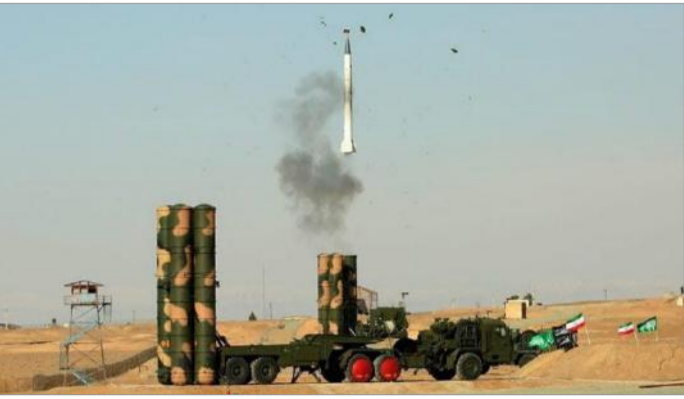
۱۴ اسفند ۱۳۹۵ روابط عمومی قرارگاه پدافند هوایی خاتم‌الانبیاء اعلام کرد در رزمایش دماوند سیستم S۳۰۰ در میدان تیر یکی از یگان‌های پدافندی آزمایش شد

۲۰۰ کیلومتر دارد. ساخت و سازه‌های اخیر نشان می‌دهد ایران این سیستم‌ها را از خارج از پایگاه‌های هوایی مورد استفاده قرار می‌دهد. اولین محموله S۳۰۰ تیرماه ۱۳۹۵ وارد ایران شد. روس‌ها این سیستم را ۱۰ تا ۱۵ سال بعد از انعقاد قرارداد تحویل دادند که به تنشی جدی در روابط تهران و مسکو تبدیل شد و کار به شکایت کشید.