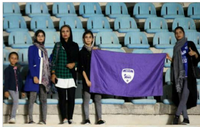
هواداران تیم اروند خرمشهر که اغلب آن‌ها اعضای خانواده بازیکنان این تیم هستند

در جریان بازی دو تیم اروند خرمشهر و مس کرمان که بابتیجه سه بر یک به سود تیم مس کرمان به پایان رسید، تعدادی از زنان روی سکوها استادیوم کوچک خرمشهر به تشویق تیم شهرشان پرداختند که پیامد سنگینی برای این تیم در پی داشت.