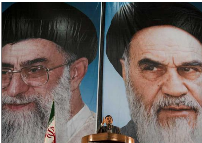
احمدی‌نژاد در میان خمینی و خامنه‌ای

رژیم جمهوری اسلامی ایران را در تاسیس تک تک احزاب اسلامگرای منطقه از حزب الدعوة اسلامی عراق، جهاد اسلامی فلسطین، حزب‌الله لبنان، مجلس اعلاى عراق، انصارالله یا «حوثی‌ها» یمن گرفته تا کمک به القاعده و طالبان و اخوان المسلمین می‌توان مشاهده کرد؛ چنانکه جای پای رژیم ولایت فقیه را در میان صدها هزار کشته، میلیون‌ها آواره، زخمی، بیوه، یتیم در عراق و سوریه نیز می‌توان دید. مردمانی که از شهرهای خود آواره شده و