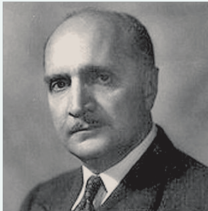
هندرسون، سفیر آمریکا در ایران

«ما معتقدیم که مصدق اینک دست به بزرگترین قمار خویش زده است که یا برنده همه چیز یا بازنده همه چیز می گردد. ما باور داریم که مصدق با روحیه کنونی اش، هرج و مرج و انقلاب را - به راحتی - بر آنچه که به مفهوم «تسلیم به انگلیس» تلقی می کند، ترجیح می دهد ... ما نمی توانیم این احتمال را که وی دست به یک اقدام نسنجیده غیرقابل برگشت نزنند، ندیده بگیریم ... ما عقیده داریم که مصدق بیشتر از پیش به اقدامات ضدانگلیسی و ضد بیگانه به منظور برانگیختن احساسات و منحرف ساختن توجه مردم از نقاط ضعف دولت خود، روی آورد.» (گزارش هندرسون، سفیر آمریکا در ایران، بتاريخ ۱۵ ژانویه ۱۹۵۲ = ۲۵ دی ماه ۱۳۳۱، تلگراف شماره ۱۰/۱۸۸۸-۱۵۵۲)