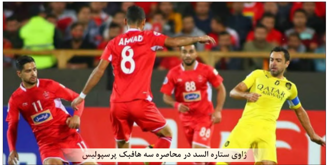
ژاوی ستاره السد در محاصره سه هافبک پرسپولیس

برانکو خلیا تشکر می کند. با توجه به اینکه او زحمت زیادی کشید و بهترین بازیکن زمین شد، دوست دارم نشست خبری را او شروع کند.» او سپس افزود: «فکر می کنم برانکو همه صحبت ها را کرد، اما به هر حال دو مسئله برای ما تعیین کننده بود. اول از همه بازیکنان که قلب شان را واقعا در زمین گذاشتند. واقعا، واقعا و واقعا بیشترین لیاقت و استحقاق برد را این بازیکنان داشتند. دوم هواداران پرشور و عزیزمان که دیدید وقتی یک بر صفر از السد عقب افتادیم، چطور حمایت و تشویق شان را ادامه دادند تا به نتیجه برسیم.»