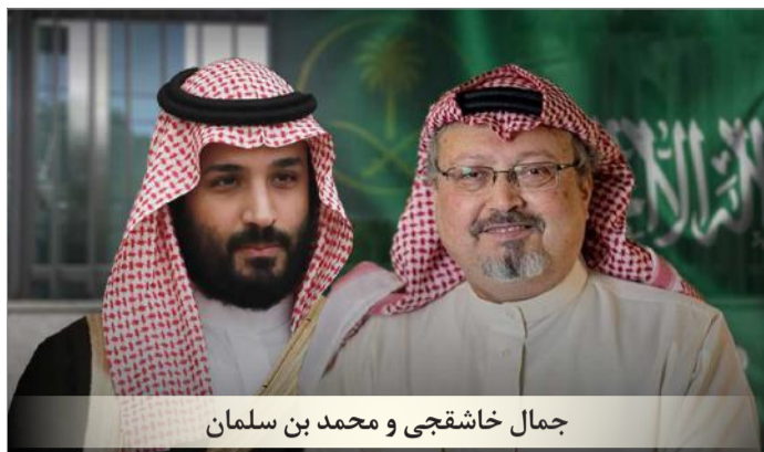
جمال خاشقجی و محمد بن سلمان

«آیا تحریم‌ها کار می‌کنند؟ شواهد چندان این موضوع را نشان نمی‌دهند» منتشر کرده بود پس از مرگ خاشقجی خواهان پرداخت هزینه توسط دولت عربستان سعودی شد. اینطور هم نبود که این روزنامه دیدگاه‌های رقیب را منعکس کند. در عصر ترامپ این روزنامه‌ها توازن را فراموش کرده‌اند (آنها در این موضوع تنها نیستند؛ رسانه‌هایی مثل رادیو فردا که با مالیات شهروندان آمریکایی اداره می‌شود بوق جناح چپ آمریکایی است و هیچ صدایی از کسانی که به سیاست‌های ترامپ رای داده‌اند در آن مشاهده نمی‌شود) جیسون رضاییان که خود از روزنامه‌نگاران نزدیک به لابی ایران (نایاک) بود و برای این روزنامه کار می‌کرد با تحریم‌های بیشتر علیه جمهوری اسلامی در دوران ترامپ مخالفت کرده بود.