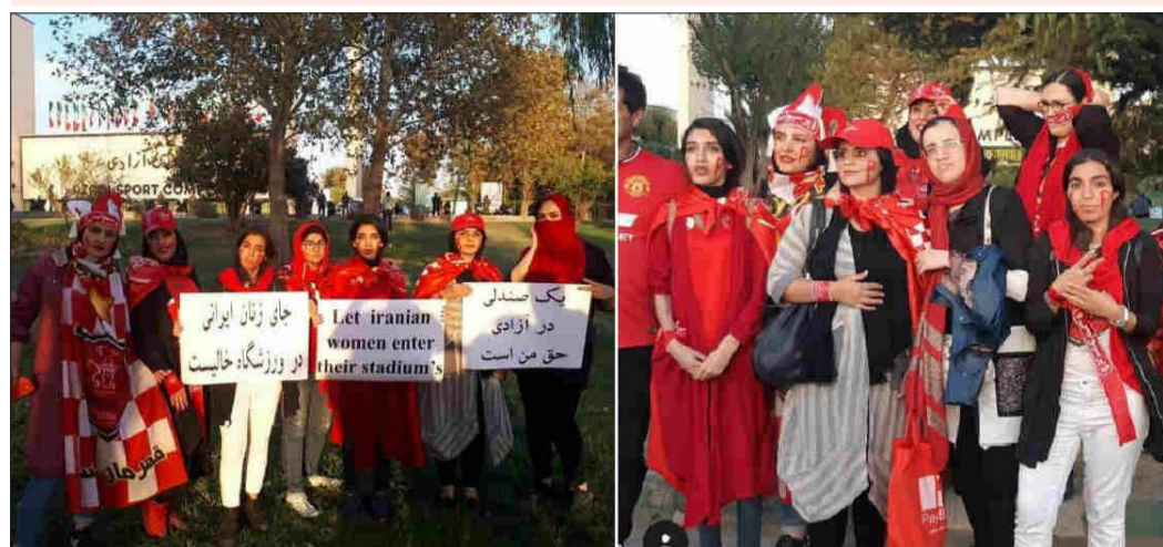
اعتراض دختران به نبودن آزادی در ضلع غربی استادیومی که نام «آزادی» بر آن گذاشته‌اند!

خوشی به پایان برسد. اینهمه در حالی بود که طبق معمول از ورود زنان به داخل استادیوم جلوگیری شد. گروهی از آنها پشت در ماندند و دست به اعتراض زدند و گروهی نیز با گریم پسرانه وارد جایگاه تماشاگران شدند.