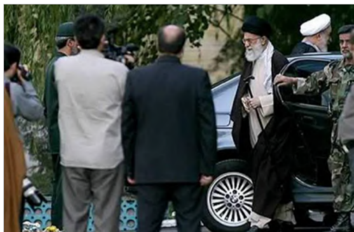
علی خامنه‌ای سال‌هاست برای تردد از BMW ضدگلوله استفاده می‌کند

مایک پمپئو همچنین در این مقاله تاکید کرده که رژیم ایران سالانه بیش از ۱۰۰ میلیون دلار در اختیار گروه‌های تروریستی فلسطینی قرار می‌دهد و به یک سرباز لبنانی سه برابر یک سرباز ایرانی حقوق پرداخت می‌کند.