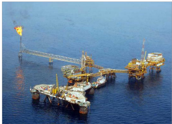
میدان نفتی ابودریه

همه چیز آماده است تا یک آغاز نمادین داشته باشیم و به تهران نشان بدهیم که اتحادیه اروپا به قول و قرارش عمل خواهد کرد.