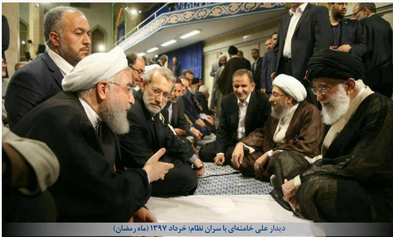
دیدار علی خامنه ای با سران نظام؛ خرداد ۱۳۹۷ (ماه رمضان)

و بمیزند، امنیت این است که غذای خوب و آب آشامیدنی در خانه توزیع شود، گرما و سرما متعادل باشد و زندگی طبیعی را به ساکنان خود عرضه کند که جمهوری اسلامی به عنوان دولت چنین خدمات اولیه ای را عرضه نمی کند. در منطقه نیز همسوسا همسایگان نیست. خانه های دیگر نو و پرفراشته اند و این خانه ای که مسئول آن جمهوری اسلامی است نه تنها عقب مانده است بلکه از این خانه کلنگی به بیرون سنگ پرتی هم می شود و شیشه های اطراف را هم می شکند. بنابراین با توجه به شرایط درونی و بیرونی و وضعیت ساختاری این حکومت باید جمهوری اسلامی را در چارچوب دولت های درمانده قرار داد.