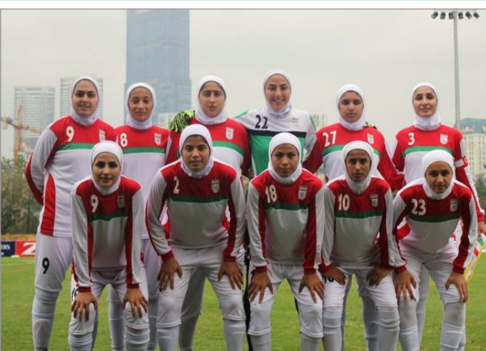
تیم ملی فوتبال دختران ایران

دور اول مسابقات انتخابی فوتبال دختران المپیک ۲۰۲۰ توکیو از ۸ تا ۱۳ نوامبر در چهار گروه برگزار می شود. تیم ملی ایران در گروه B این رقابت ها با تیم های هنگ کنگ، امارات و لبنان هم گروه است. زمان برگزاری دیدارهای ایران چنین است: پنجشنبه ۱۷ آبان: ایران - لبنان، هنگ کنگ - امارات یکشنبه ۲۰ آبان: لبنان - هنگ کنگ، ایران - امارات سه شنبه ۲۲ آبان: ایران - هنگ کنگ، امارات - لبنان از هر گروه ۲ تیم به مرحله دوم این بازی ها که در فروردین ماه سال