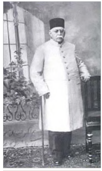
عبدالحسین میرزا فرمانفرما

در گزارش تلگرافی به لندن، مورخ ۲۷ اکتبر، نورمن استعفای مشیرالدوله و موافقت احمدشاه با زمامداری سپهدار را با اطلاع «کوزن» رساند و اضافه کرد: «برای استحضار عالی جناب لازم است این مطلب را هم بیفزایم که قبل از رفتن به نزد شاه، نظر سپهدار را غیر مستقیم جویا شده و از او قول و تعهد گرفته بودم که در صورت انتصاب به مقام نخست وزیر طبق پیشنهادها و راهنمایی های دولت انگلستان عمل کند.»