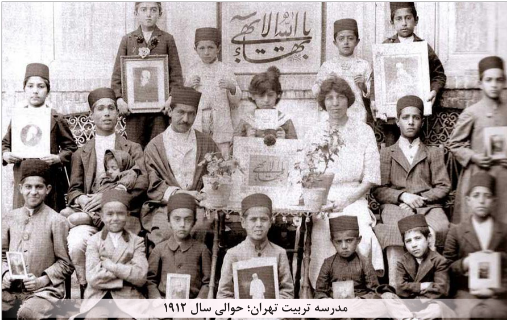
مدرسه تربیت تهران؛ حوالی سال ۱۹۱۲

برای اینکه سوء تفاهمی ایجاد نشود بهایبان می‌روند و خبر هم می‌دهند. صدها نمونه از پلمپ مغازه‌های بهایبان گزارش شده که بعضی از مالکان آنها قبلاً در زندان بوده‌اند و حالا به‌این علت یا مغازه‌شان بسته شده یا اینکه باید برگردند و دوباره بازجویی و چه بسا زندانی شوند.» به گفته‌این استاد اقتصاد، درهای کسب درآمد نیز به روی بهایبان بسته است: «از آغاز انقلاب اسلامی تا کنون به بهایبان اجازه اشتغال در وزارتخانه‌های دولتی داده نشده. اگر در شرکت‌های خصوصی کار می‌کنند به این شرکت‌ها فشار وارد می‌کنند که باید کارمند بهایی خود را اخراج کنند وگرنه شرکت گرفتار خواهد شد. می‌کنیم. ما نمونه‌هایی داشته‌ایم که می‌توانید اسناد آن را در خانه اسناد بهایی‌ستیزی ملاحظه کنید که کاملاً سازمانیافته این گونه فشارها را به جامعه بهایبان وارد می‌کنند. حتی در قوانین کارایی و اشتغال به صراحت آمده است کسانی که عضو فرقه ضاله هستند باید بازنشستگی‌شان قطع شود!»