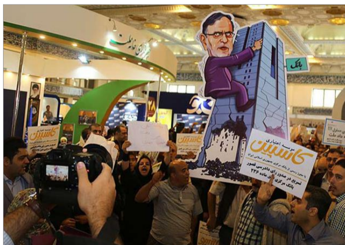
مالباختگان موسسات اعتباری تا کنون ده‌ها تجمع اعتراضی برگزار کرده و از بانک مرکزی و دولت خواسته‌اند پول آنها را بازگرداند

صداقت مطبوعات که نمونه‌اش در پروپاگاندای کاهش قیمت دلار رخ داد، باعث کاهش اقبال عمومی نسبت به روزنامه‌ها و وبسایت‌های داخلی شده و در نتیجه تمایل به کسب اطلاعات از طریق رسانه‌های خارج از کشور را افزایش داده است.