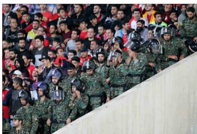
ترس از آشوب و اعتراض در استادیوم و حضور یگان ویژه

نتیجه آن شد که پس از پایان بازی و هنگام خروج جمعیت از استادیوم ۲۷۴ نفر به دلیل ازدحام مصدوم شدند که کار چهار نفر به مراکز