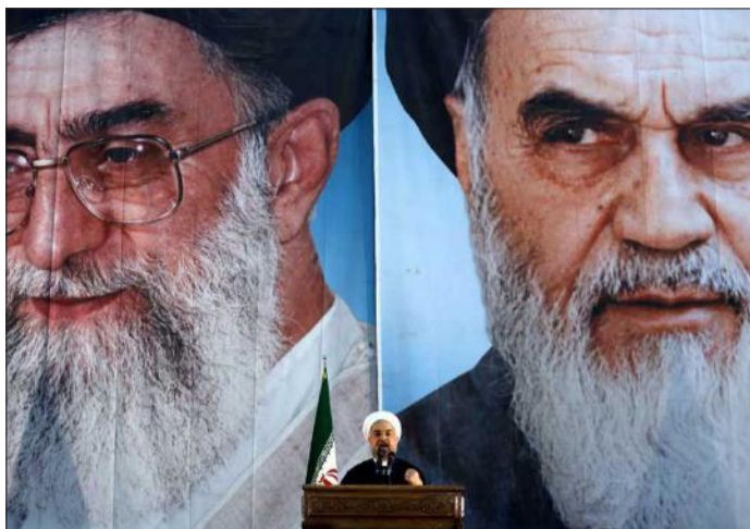
روحانی در میان خمینی و خامنه‌ای

انقلاب و ایدئولوژی خود همه ابزارها و روش‌های جنایتکارانه را توجیه می‌کند؛ از بحران آفرینی گرفته تا به راه انداختن جنگ‌های فرقه‌ای داخلی در کشورهای همسایه تا اقدامات تروریستی مانند آنچه احزاب دست‌نشانده آن در لبنان، عراق و یمن انجام می‌دهند.