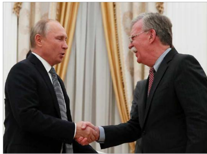
جان بولتون و ولادیمیر پوتین؛ مسکو ۲۳ اکتبر ۲۰۱۸

می‌شود زیرا روسیه به آن پایبند نبوده است. این در حالیست که روسیه این ادعا را رد می‌کند و پایگاه‌های دفاعی آمریکا در کشورهای شرق اروپا را دلیلی برای افزایش تنش می‌داند. بولتون همچنین افزود، وقتی پوتین را از تصمیم ترامپ با خبر کردم آن را حرکتی گستاخانه خواندم.