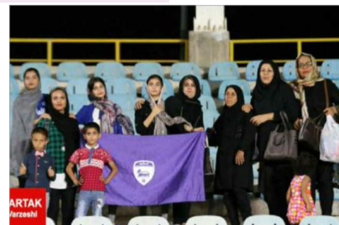
عکس دسته جمعی زنان هوادار اروند که برای تشویق تیمی آمدند که بازیکنانش اعضای خانواده آنها هستند؛ اما به خاطر این حضور جریمه می‌شوند!

رسانه‌های ورزشی نوشته‌اند: «باتوجه به عدم هماهنگی با مسئولین کشوری و مسئولین ذیربط در خصوص حضور بانوان در ورزشگاه، فدراسیون فوتبال به شدت علیه باشگاه اروند که خودسرانه اقدام به حضور بانوان در ورزشگاه کرده، جبهه