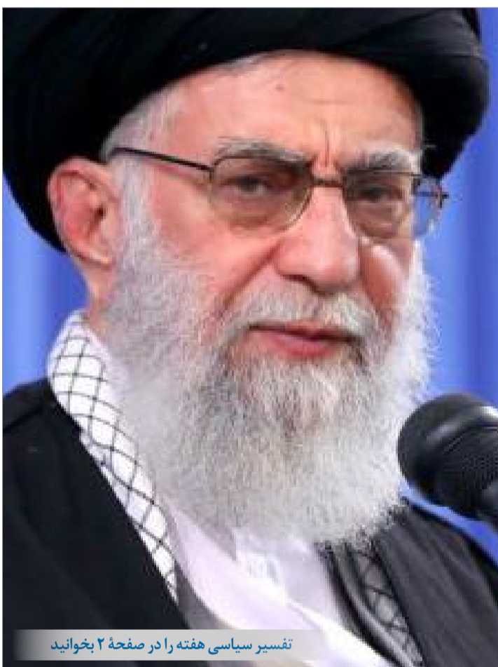
تفسیر سیاسی هفته را در صفحه ۲ بخوانید