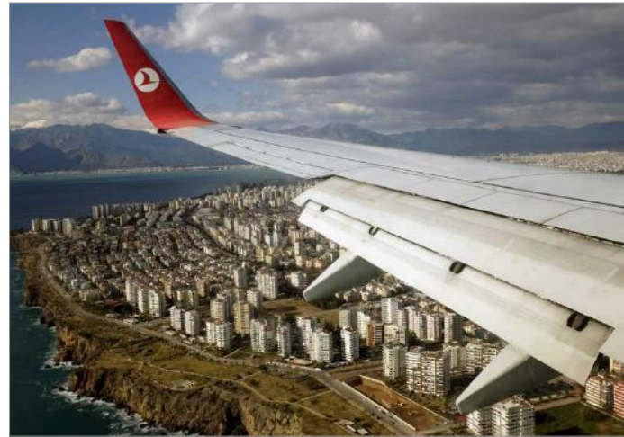
نمایی از آنتالیا؛ ۲۰۱۶