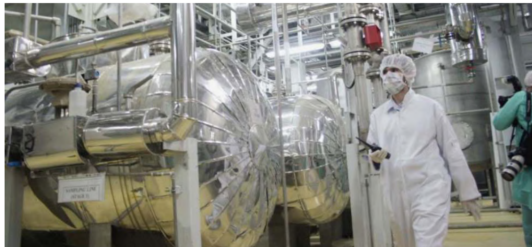
آژانس بین‌المللی انرژی اتمی در گزارشی جدید اقدام ایران در خصوص انتقال یک سیلندر یا گاز هگزافلوراید اورانیوم به سایت فردو و اتصال آن به سانتریفیوژها در این مرکز را تأیید کرده

● غریب آبادی نماینده جمهوری اسلامی در شورای حکام: علت جلوگیری از ورود یکی از بازرسان آژانس به تأسیسات غنی‌سازی نطنز همراه داشتن آثاری از نیترات انفجاری بوده. ● آژانس بین‌المللی انرژی اتمی گفته رفتار ایران با بازرسان این سازمان قابل قبول نیست. ● نتانیاهو می‌گوید زمان بازگشت تحریم‌های شورای امنیتی علیه رژیم ایران فرا رسیده است و باید جمهوری اسلامی تحت فشار قرار بگیرد تا رویکرد خود را تغییر دهد و حمله به کشورهای خاورمیانه و تهدید اسرائیل را متوقف کند.