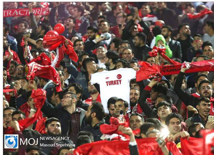
حمل پرچم و لباس تیم ملی ترکیه در دیدار استقلال با تراکتورسازی تبریز بیش از هر زمان دیگری مورد توجه رسانه‌های ترکیه قرار گرفت

با خود روی سکوها آورده بودند که روی آن نوشته بود، «چکسلاواکی یا یوگسلاوی؟ انتخاب با شماست»