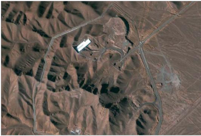
سایت فردو قم؛ عکس: سال ۲۰۱۳

همزمان با این تحولات منابع خبری به نقل از دیپلمات‌های آگاه و نزدیک به آژانس بین‌المللی انرژی اتمی، چهارشنبه، ۶ نوامبر، گزارش دادند «ایران یک بازرسی زن آژانس را برای مدت کوتاهی بازداشت و مدارک سفر او را توقیف کرده است.»