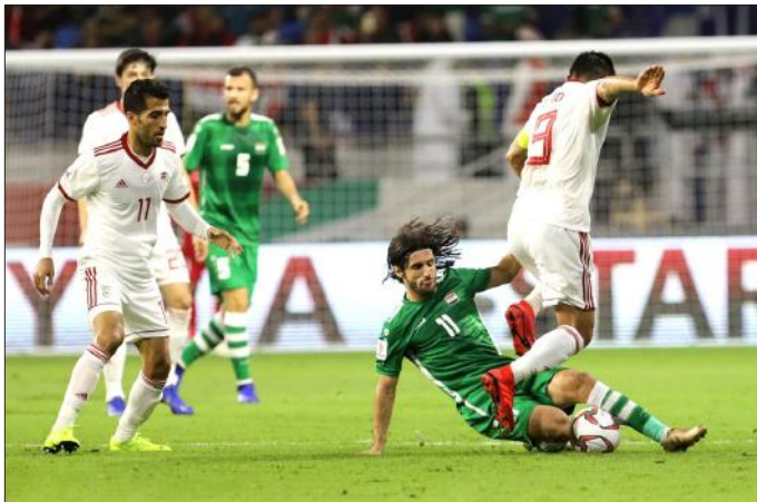
عراقی‌ها تلاش می‌کردند اگر این دیدار در بصره انجام نشود در اربیل میزبان ایران باشند

رقابت‌های بین‌المللی آماده است اما تظاهرات به این شهر نیز رسید. مردم عراق در شهرهای مختلف به نهادهای وابسته به حکومت ایران حمله کرده و پرچم جمهوری اسلامی و پوسترهای خمینی و خامنه‌ای و قاسم سلیمانی را پایین کشیده و لگدکوب کردند.