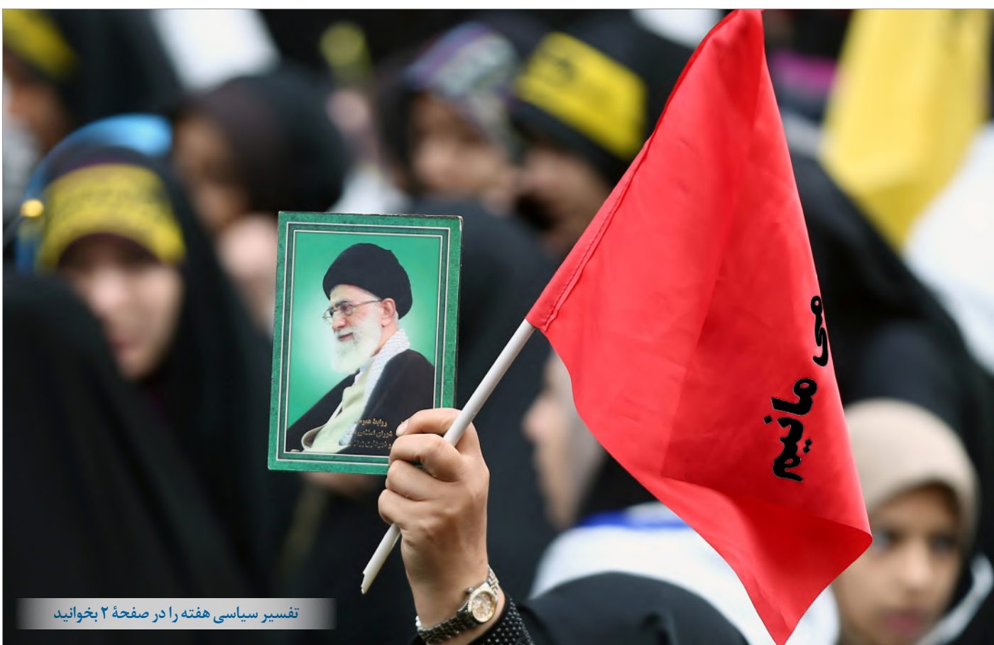
تفسیر سیاسی هفته را در صفحه ۲ بخوانید