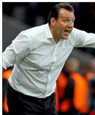
قرارداد مارک ویلموتس بلژیکی با ایران سه ساله است

با حل این مشکل همه تمرکزها روی بازی با عراق باشد. «وی در مورد اینکه آیا ممکن است به خاطر تحریم‌هایی که وجود دارد پرداخت مطالبات ویلموتس در تهران باشد گفت: «بعید می‌دانم این اتفاق بیفتد.» بحث درخواست مارک ویلموتس برای جدایی از تیم ملی فوتبال ایران بازتاب گسترده‌ای در رسانه‌های بلژیک داشته است. هرچند فدراسیون فوتبال ایران اعلام کرده که حقوق ویلموتس واریز شده اما در حال حاضر رسانه‌های بلژیک از مشکلات مالی به عنوان دلیل استعفا ویلموتس یاد می‌کنند.