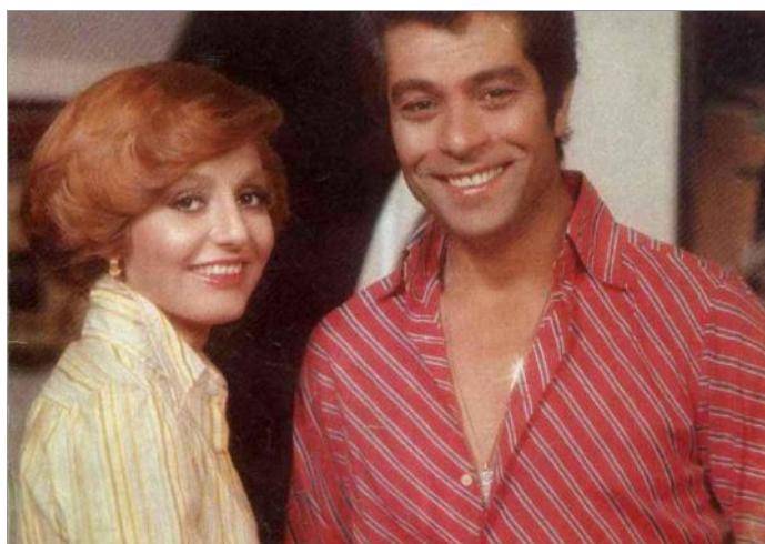
بهروز وثوقی و گوگوش پیش از انقلاب اسلامی در ایران

ثبت سوابق سینماگران ایرانی راه‌اندازی شده و آرشیوی از هنرمندان ایرانی در عرصه سینماست.