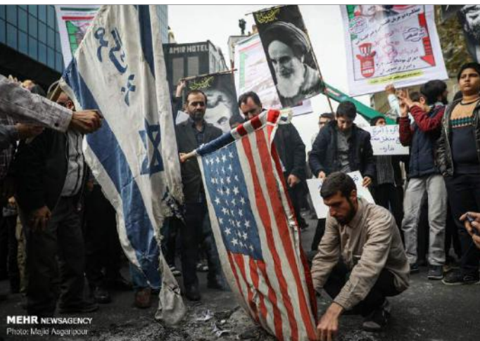
آتش زدن پرچم آمریکا و اسرائیل در مراسم حکومتی سالگرد اشغال سفارت آمریکا در تهران، ۱۳ آبان ۱۳۹۸

● یک مقام وزارت خارجه آمریکا می‌گوید مجتبی فرزند دوم علی خامنه‌ای کسی است که برای پیشبرد جاه طلبی‌های منطقه‌ای پدر و اهداف سرکوبگرانه داخلی وی با قاسم سلیمانی فرمانده نیروی قدس سپاه پاسداران انقلاب اسلامی و همچنین بسیج همکاری نزدیک دارد.