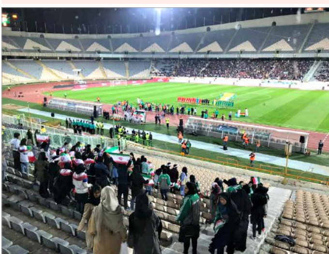
حضور زنان در ورزشگاه آزادی

روزنامه جوان از انتشارات سپاه پاسداران انقلاب اسلامی نوشته است: همزمان با نشست خانم‌ها روی سکوی ورزشگاه صدهزار نفری تهران برای تماشای مسابقه ایران و کامبوج، برای اولین بار تبلیغ لوازم بهداشتی زنان نیز شروع شد. تو خود حدیث مفصل بخوان از این تبلیغ!