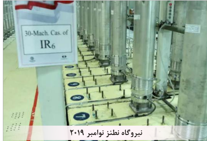
نیروگاه نطنز نوامبر ۲۰۱۹

هسته‌ای رژیم ایران را رد کنند و برای تشدید فشار علیه این کشور گام‌های جدی بردارند. به گفته پمپئو تحریکات اتمی بی‌شمار و ادامه‌دار ایران دست‌زدن به چنین اقدامی را ضروری ساخته است. شواهد نشان می‌دهد که فشارهای بین‌المللی بر فعالیت‌های اتمی جمهوری اسلامی افزایش یافته. امانوئل ماکرون همچنان برای میانجیگری بین تهران و واشنگتن تلاش می‌کند اما رهبری جمهوری اسلامی اقدامات اروپا و آمریکا را علیه خود می‌بیند. روزنامه کیهان چاپ تهران نوشت بین پاریس و واشنگتن تقسیم کار شده است. جمهوری اسلامی «گام چهارم» کاهش تعدادات اتمی خود را از روز پنجشنبه آغاز کرده و آمریکا این اقدامات را در راستای ادامه‌ی اخذی هسته‌ای می‌داند و به همین دلیل از همه کشورهای مؤثر خواسته در مقابل آن ایستادگی کنند. اما در تهران می‌گویند این اقدام بازتابی از کارشکنی ترامپ و رفتار خنثای اروپا است.