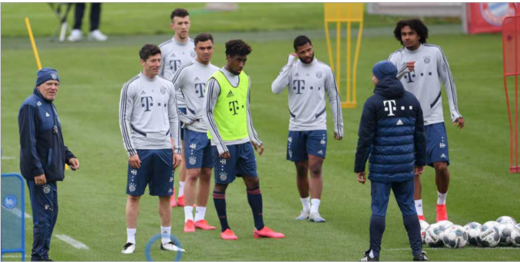
تیم‌های مختلف آلمان تمرین‌های خود را آغاز کرده‌اند؛ تیم بایرن مونیخ؛ ۵ مه ۲۰۲۰

صدراعظم آلمان روز چهارشنبه به مردم آن کشور گفت: در کنترل ویروس کرونا موفق بوده‌ایم و به