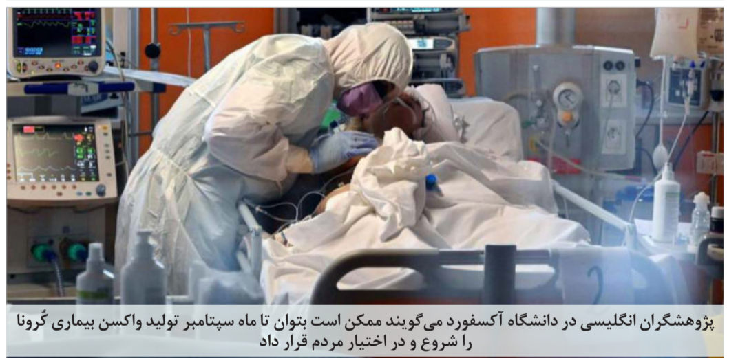
پژوهشگران انگلیسی در دانشگاه آکسفورد می‌گویند ممکن است بتوان تا ماه سپتامبر تولید واکسن بیماری کرونا را شروع و در اختیار مردم قرار داد

● نهادهای امنیتی انگلیسی می‌گویند هک‌های ایرانی و روسی به وبسایت دانشگاه‌ها و پزشکی که در مورد تولید واکسن و کیت‌های تشخیص کرونا تحقیق می‌کنند حمله کرده‌اند.