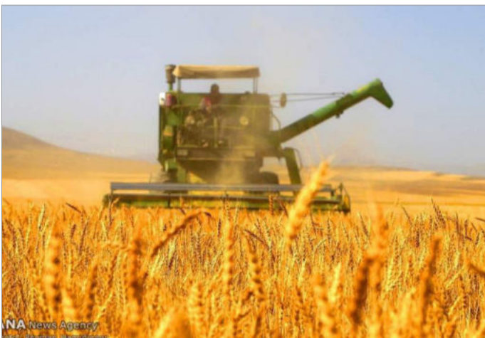
در ایران سرپرست معاونت امور زراعت و وزارت جهاد کشاورزی از اقداماتی برای مقابله با تأثیرات ویروس کرونا بر تولید محصولات زراعی خبر داد

میلیون تن خواهد بود و دولت قرار است حدود ۵/۱۰ میلیون تن از تولیدات داخلی را خریداری کند. ولی منتقدان می‌گویند به دلیل سوء مدیریت و تعیین قیمت کمتر برای گندم داخلی، هر سال میزان خرید دولت کاهش یافته و در نتیجه ایران مجبور است بخش عمده از نیاز گندم خود را از خارج تأمین کند. رویترز به نقل از منابع آگاه نوشته است، بسیاری از کشاورزان گندم خود را به دامداران می‌فروشند تا از آن به عنوان خوراک دام استفاده کنند. قیمتی که دامداران پرداخت می‌کنند تقریباً دو برابر مبلغی است که دولت برای گندم به کشاورزان پرداخت می‌کند. اینهمه در حالیست که علی‌خامنه‌ای در یک سخنرانی عنوان کرد ایران به خودکفایی در زمینه کشاورزی به‌خصوص تولید محصولات اساسی، همچون گندم، دانه‌های روغنی، گیاهان دارویی و آبریان نیاز دارد.