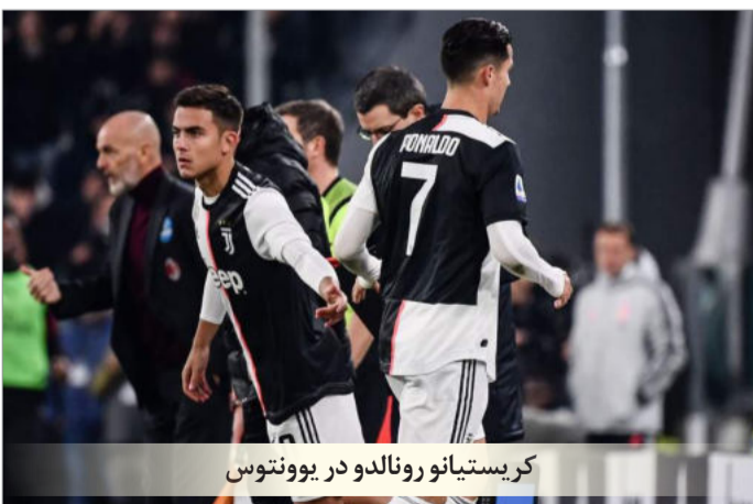
کریستیانو رونالدو در بونونتوس

این طرح به سود تیم‌هایی خواهد بود که بازیکنان ذخیره بهتری دارند که این امتیاز مستقیم به بودجه باشگاه‌ها وابسته است. تیم‌هایی که نیمکت‌نشینان آنها از نظر فنی و آمادگی جسمانی با بازیکنان اصلی فاصله دارند روزهای سخت‌تری پس از کرونا خواهند داشت.