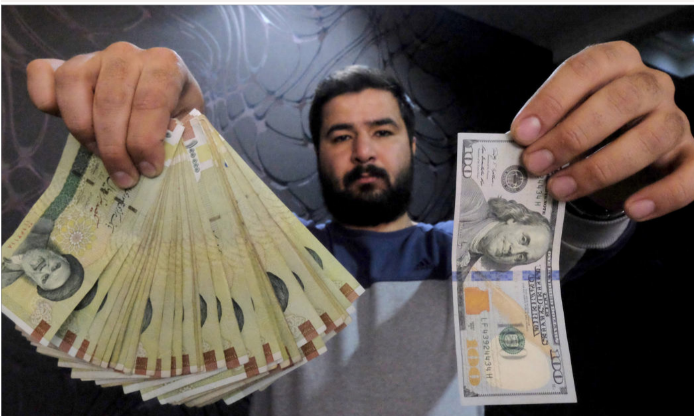
تفسیر سیاسی هفته را در صفحه ۲ بخوانید

● کمبود شدید منابع درآمدی، کسری میلیاردی بودجه و رکود ناشی از کرونا دولت را واداشته تا به تصمیمات از این ستون به آن ستون روی بیاورد