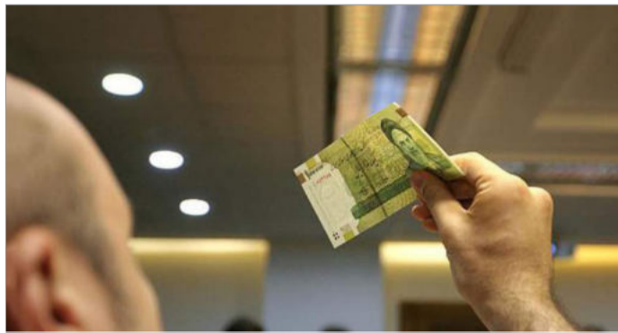
نمایندگان مجلس شورای اسلامی ۱۵ اردیبهشت با کلیات لایحه حذف چهار صفر از پول ملی طی پنج سال موافقت کردند

نمی‌دهد. قیمت‌های سر به فلک کشیده و کمبود غذا در ایران اولین نتایج تحریم‌های اعمال شده علیه جمهوری اسلامی است و به این علت قانونگذاران این کشور تصمیم گرفتند نفس تازه‌ای به پول رایج ایران بدمند یا دست‌کم اینطور به نظر می‌رسد که قصد این کار را دارند.