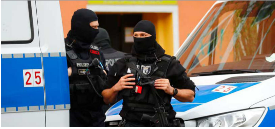
پلیس روز ۳۰ آوریل مراکز اسلامی وابسته به جمهوری اسلامی و حزب الله لبنان را در چند شهر آلمان از جمله برلین مورد بازرسی قرار داد و اسناد و دستگاه‌های آنها را ضبط کرد

یکی دیگر از دلایل عصبانیت رژیم جمهوری اسلامی در رابطه با تروریست خواندن حزب الله لبنان که رژیم تهران با وجود تنگدستی‌های ناشی از ممنوعیت فروش نفت، همچنان به کمک‌های مالی خود به این گروه ادامه می‌دهد، لغو تظاهرات «روز قدس» در شهر برلین در آخرین جمعه ماه رمضان است که قرار بود روز ۱۶ ماه مه برگزار گردد.