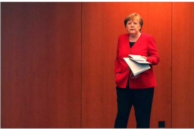
آنگلا مرکل در کنفرانس خبری روز ۶ مه ۲۰۲۰ که طی آن کاهش محدودیت‌ها را در این کشور اعلام کرد

محدودیت‌ها که موجب کاهش ابتلا و تعداد مرگ و میر در آن کشور شده تشکر کرد و از آنها خواست همچنان به توصیه‌های بهداشتی برای پیشگیری از شیوع این ویروس هولناک عمل کنند.