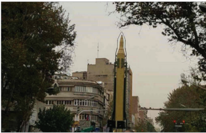
نمایش مجدد موشک بالستیک در یک راهپیمایی به عنوان نماد اقتدار

شورای حکام آژانس بین‌المللی انرژی اتمی، خواهان بازگشت سریع ایران اتمی، و آمریکا به اجرای تعهدات برجامی شده‌اند. آنهم در حالی که با نقض مفاد آن توسط جمهوری اسلامی، و همچنین محدودیت زمانی آن که در ژوئیه ۲۰۱۵ یعنی شش سال پیش به دست آمد، در عمل چیزی برجام باقی نمانده است.