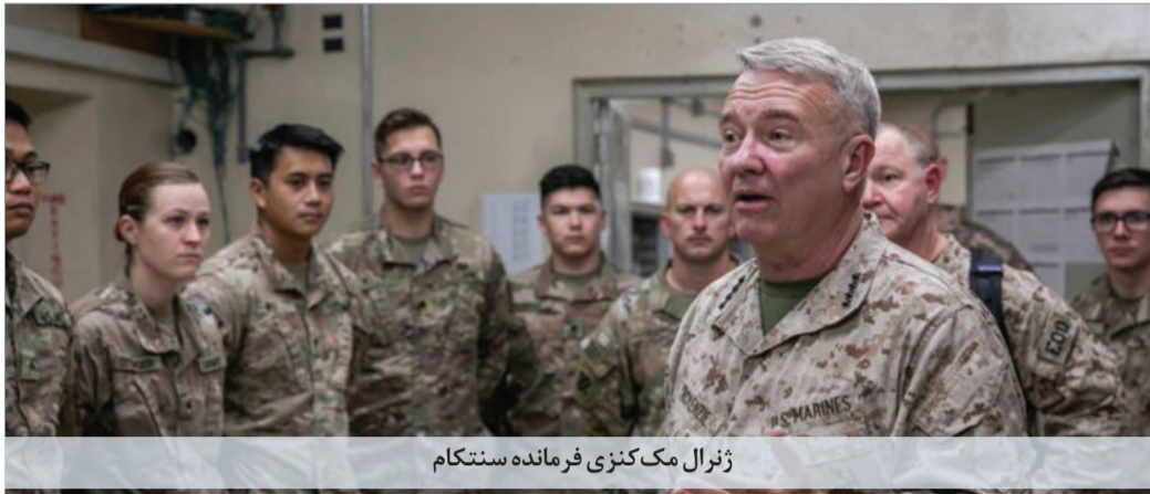
ژنرال مک کنزی فرمانده سنتکام

اورانیوم را به ۶۰ درصد رسانده است و اجازه بازدید بازرسان آژانس از کارخانه ساخت سانتریفیوژ «تسا» در کرج را صادر نکرده است. رافائل گروسی مدیرکل آژانس بین‌المللی انرژی اتمی پس از بازگشت از تهران گفت مذاکراتش با مقامات جمهوری اسلامی بی‌نتیجه مانده است.