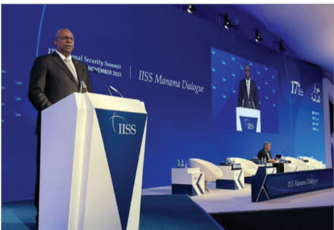
لوید اوستین وزیر دفاع آمریکا در نشست منامه ۲۰۲۱

وزیر دفاع آمریکا در نشست امنیت منطقه‌ای بحرین موسوم به «گفتگوهای