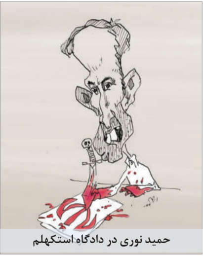
حمید نوری در دادگاه استکهلم

حمید نوری مدعی شده که اتهامات این پرونده متوجه ۸۵ میلیون ایرانی عزت‌مند و باشرافت است که وی به نمایندگی از آنها در این دادگاه متهم شده و «خدا» با اوست! روانکاو ساکن ایران در همین ارتباط به کیهان لندن می‌گوید: «یک موضوع دیگر در خودشیفتگی این فرد، موضوع «استحقاق» است؛ او متقاعد است که «همیشه حق با من است!» «استحقاق» در روانشناسی یک طیف است که در جرای از آن لازم است اما وقتی بیش از حد می‌شود، فرد را دچار مشکلات متعدد می‌کند که یک جنبه‌ی آن نداشتن عذاب وجدان است! یعنی دستاویزی به فرد می‌دهد که عذاب وجدان‌های او را پاک می‌کند. همچنین در کنار خودشیفتگی، در این فرد نشانه‌هایی از شخصیت ضداجتماعی نیز وجود دارد. افراد ضداجتماع زیاد دروغ می‌گویند و فریب‌کارند و عذاب وجدان هم ندارند! کسی که در کشتار ۶۷ دست داشته بطور مشخص یک شخصیت ضداجتماع و حتا ضد عرف دارد.» این روانکاو در ادامه توضیح می‌دهد: «یکی از ویژگی‌های این افراد اینست که عوام‌فریب هستند. مثلاً وی یکجا در دفاعیات گفته اتهامات و پرونده و دادگاه را علیه میلیون‌ها ایرانی می‌داند. بخشی از این ادعا به آموزش‌های امنیتی و ایدئولوژیک او بر می‌گردد و بخشی به موضوع «استحقاق» که