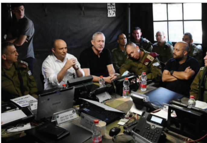
نفتالی بنت نخست وزیر اسرائیل در کنار شماری از نظامیان ارشد اسرائیل از جمله بنی گانتز وزیر دفاع این کشور

استدلال‌های مقام‌های اسرائیلی در مورد مذاکرات هسته‌ای را رد می‌کند. نویسنده گزارش «نیویورک تایمز» دیوید ای. سانگر خبرنگار امنیت ملی این روزنامه و همچنین رسانه کاخ سفید است. آنچه او نوشته در واقع محاسبات بایده است که در آن به این نتیجه رسیده به توافقی بازگردد که در صورت دست یافتن، مفاد آن اندکی با توافق اتمی در سال ۲۰۱۵ تفاوت خواهد داشت. این در حالیست که شش سال از توافق گذشته و «برجام» در عمل منتفی شده است. اما با توجه به سیاست‌های جمهوری اسلامی برای متوقف کردن عمده مذاکرات، امید جو بایدن را به اینکه بتواند در سال اول ریاست جمهوری خود به توافق اتمی بازگردد و یک معامله «طولانی‌تر و مستحکم‌تر» با ایران داشته باشد، از بین برده است. رژیم ایران نیز ظاهراً به بهانه انتخابات ریاست جمهوری اسلامی در ۲۸ خرداد ۱۴۰۰ مذاکرات را به تأخیر انداخت.