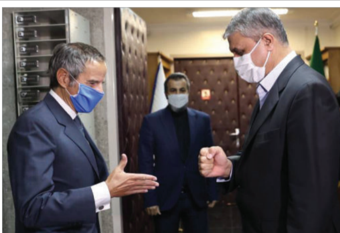
خوش و بش گروسی با اسلامی در اولین دیدارش به عنوان رئیس سازمان انرژی اتمی جمهوری اسلامی

رژیم ولایت فقیه دوتابعیتی بودن شهروندان خود را به رسمیت نمی‌شناسد و به گفته دولت‌های غربی و نهادهای حقوق بشر، رژیم جمهوری اسلامی از دستگیری و به گروگان گرفتن افراد دوتابعیتی به عنوان ابزار فشار برای پیشبرد مقاصد خود مانند چانه‌زنی در مورد تحریم‌ها و اخاذی در دیگر مسائل