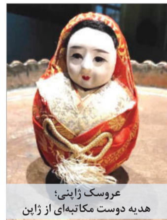
عروسک ژاپنی؛ هدیه دوست مکاتبه‌ای از ژاپن