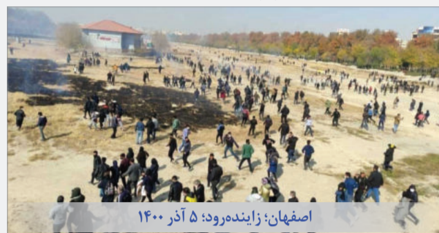
اصفهان؛ زاینده رود؛ ۵ آذر ۱۴۰۰

این سطور در حالی نوشته می شود که کشاورزان اصفهان با یورش شبانه یگان ضدشورش و نیروهای سرکوب در بستر خشک زاینده رود مورد ضرب و جرح قرار گرفته اند. تازه ترین ویدئوها از زخمی شدن معترضان و شلیک گلوله به سر شهروندان از جمله یک زن و یک مرد جوان خبر می دهند.