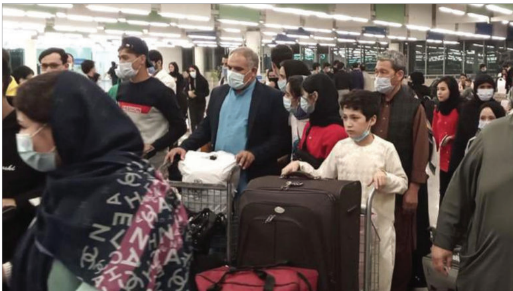
گروهی از دختران فوتبالیست افغانستان و خانواده‌هایشان وارد بریتانیا شدند؛ ۱۸ نوامبر ۲۰۲۱

به گزارش آسوشیتدپرس، یکی از باشگاه‌های فوتبال در بریتانیا نیز در فراهم نمودن امکانات لازم برای ادامه زندگی و کار این دختران فوتبالیست نقش اساسی دارد.