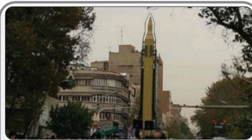
احتمال فعال شدن «مکانیسم ماشه» علیه جمهوری اسلامی در صورت شکست مذاکرات وین