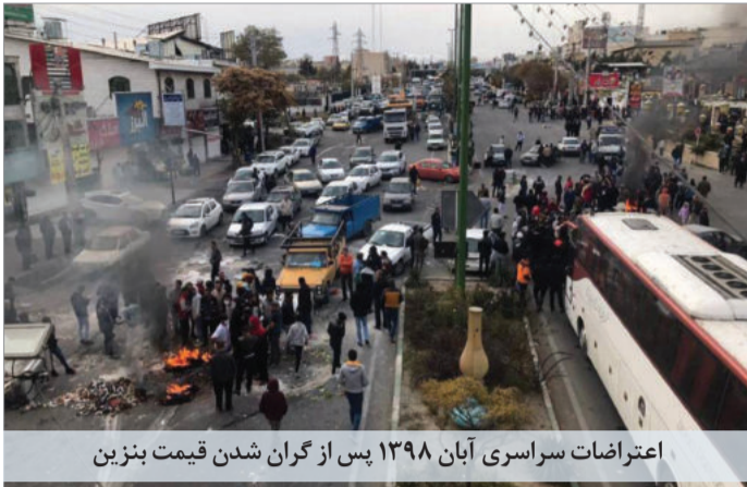
اعتراضات سراسری آبان ۱۳۹۸ پس از کران شدن قیمت بنزین

خارجی آن مبتنی بر حقوق بشر و دموکراسی خواهد بود. مردم ایران که در هر فرصتی به مبارزه با رژیم ادامه می دهند، به همین ترتیب به دنبال حقوق بشر، دموکراسی و دولتی هستند که نماینده ارزش‌ها و آرمان‌های آنها باشد... با توجه به شکافی که بین مردم ایران و رژیم جمهوری اسلامی وجود دارد، ما ایستادن و حمایت از مردم ایران را نه تنها یک ضرورت راهبردی، بلکه یک ضرورت اخلاقی می‌دانیم.» امضاکنندگان این نامه خطاب به کاخ سفید می‌نویسند: «از آنجایی که ایالات متحده برای مذاکره غیرمستقیم با جمهوری اسلامی بر سر برنامه‌های هسته‌ای آن آماده می‌شود و موضوعاتی مانند رفع تحریم‌ها، بازگشت مجدد به توافق اتمی و موارد دیگر اهمیت پیدا می‌کند، ایالات متحده نمی‌تواند اجازه دهد که مسائل حقوق بشر نادیده گرفته شود یا به موضوع فرعی تبدیل گردد... تخفیف در تحریم‌ها به حکومتی که نمایندگانش هم‌چنین می‌خواهند بدانند دولت بایدن در قبال نقض مداوم حقوق شهروندی توسط رژیم ایران شامل قتل، شکنجه و بازداشت معترضان که شماری از آنها در ماه‌های اخیر محاکمه شدند چه اقدامی انجام داده است.