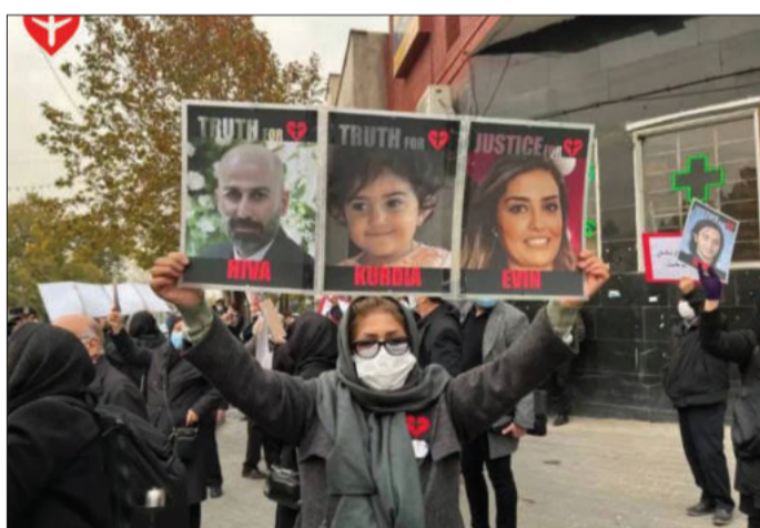
در تصاویری که از این تجمع در شبکه‌های اجتماعی منتشر شده خانواده‌ها عکس‌هایی از قربانیان پرواز ۷۵۲ و پلاکاردهایی در اعتراض به نحوه برگزاری این دادگاه به همراه داشتند

اوایل فروردین ۱۴۰۰ اولکسی دانیلوف دبیر شورای دفاع و امنیت ملی اوکراین در مصاحبه با روزنامه کانادایی «گلوبل اند میل» گفت سپاه پاسداران انقلاب اسلامی «عمدی» به هواپیمای مسافری «اوکراین اینترنشنال» شلیک کرده و آن را ساقط نموده است تا از «افزایش تنش منطقه‌ای بین ایران و آمریکا جلوگیری کند.» کیهان لندن نخستین رسانه ایرانی بود که موضوع «سقوط بر اثر اصابت» و نه سقوط بر اثر «حادثه» را صبح ۱۸ دی‌ماه ۹۸ در گزارش خود مطرح کرد.