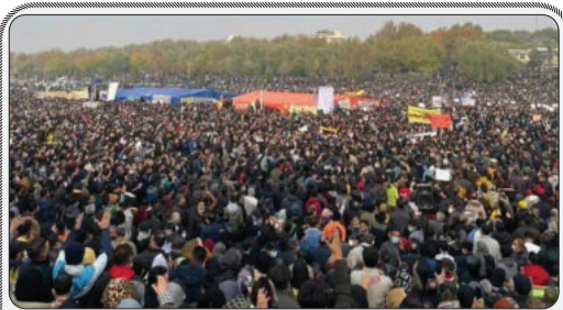
«افزایش ذخایر کالاهای استراتژیک در ایران»؛ ترس حکومت از اعتراضات اجتماعی یا جنگ؟!؛