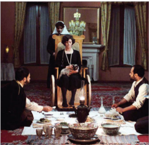
صحنه‌هایی از «شترنج باد»