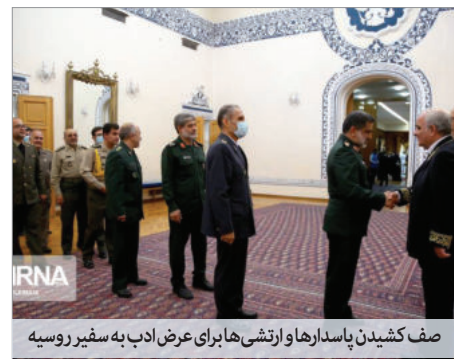
صف کشیدن پاسدارها و ارتشی‌ها برای عرض ادب به سفیر روسیه

برخی حضور مقامات جمهوری اسلامی در این مراسم را «نوکری برای ارباب» خواندند. در سنوات گذشته عباس عراقچی معاون وزیر خارجه یا شماری از نمایندگان مجلس شورای اسلامی در این مراسم شرکت کرده بودند اما حضور در سطح وزیر در این مراسم سفارت روسیه سابقه نداشته است. حشمت‌الله فلاحت‌پیشه رئیس پیشین کمیسیون امنیتی ملی مجلس شورای اسلامی در بهمن ۱۳۹۷ در انتقاد به روسیه گفته بود در جریان حملات اسرائیل به مقرهای سپاه در سوریه روس‌ها سیستم‌های پدافندی خود را از کار می‌اندازند. او همچنین در چند مصاحبه تأکید کرد