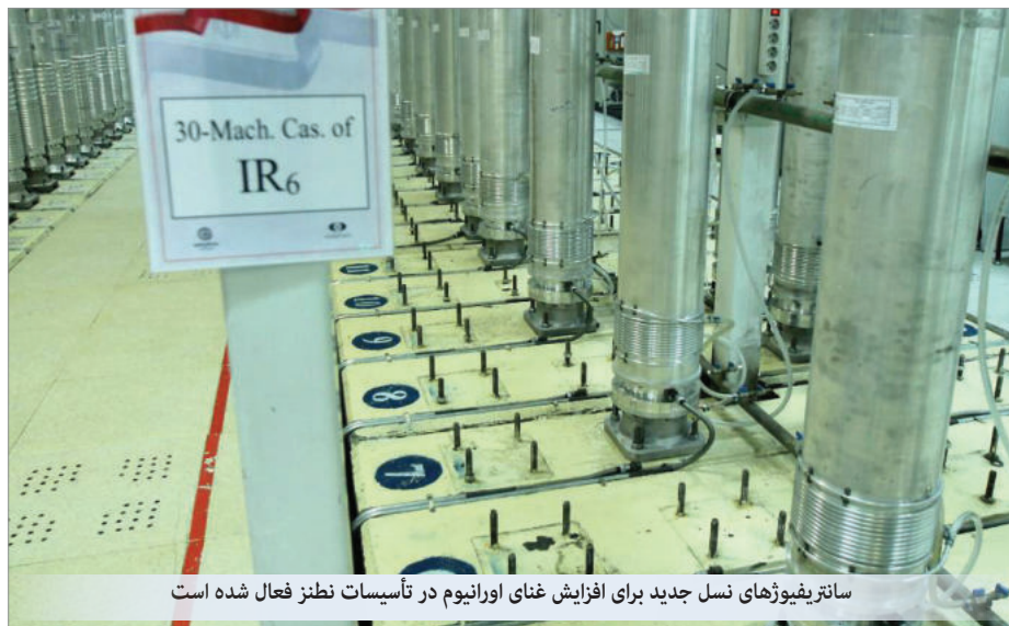
سانتریفیوژهای نسل جدید برای افزایش غنای اورانیوم در تأسیسات نطنز فعال شده است

رافائل گروسی مدیر آژانس نیز به دلیل مسئولیت سنگینی که بر عهده اوست، چندین بار اعلام کرده است.