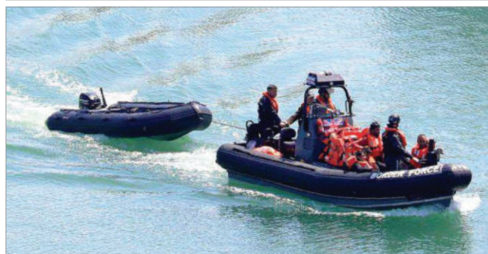
پناهجویان با قایق از کانال مانس عبور می‌کنند تا وارد خاک بریتانیا شوند

اساس تجربه‌ای سنگین، چنین اقبالی به دستاوردهای قبل از انقلاب و پهلوی‌ها برای ساختن آینده دارد، همچنان باید برای «اتحاد» با جریانات و افرادی تلاش کرد که نه با انقلاب ارتجاعی ۵۷ بلکه فقط با معلول آن، یعنی جمهوری اسلامی مخالفند؟!