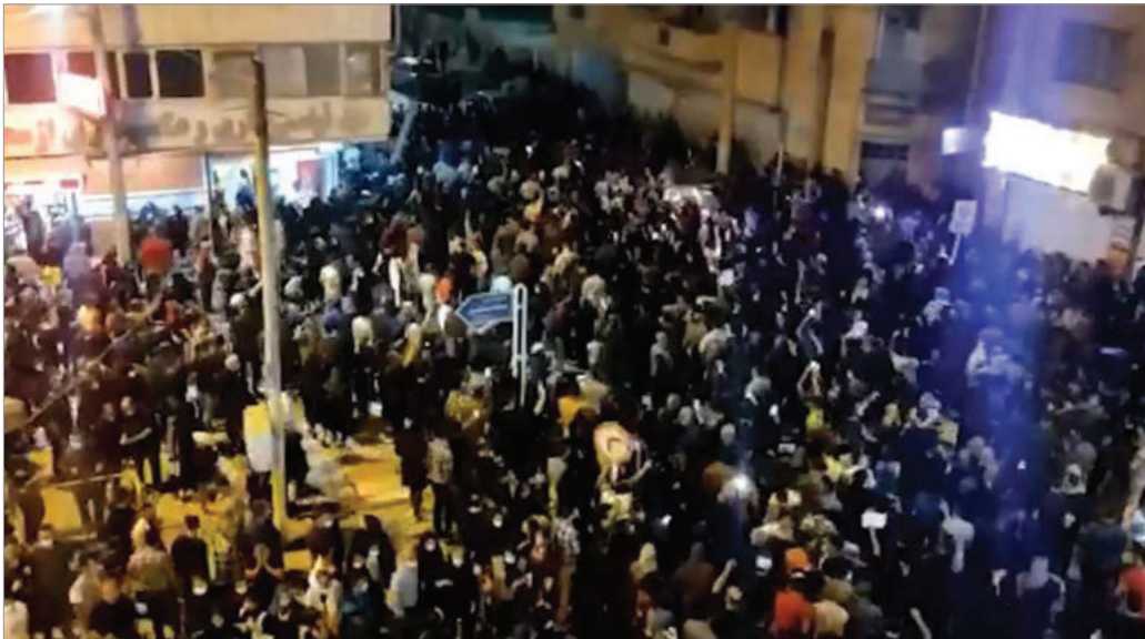
اعتراضات شبانه مردم آبادان؛ ۴ خرداد ۱۴۰۱