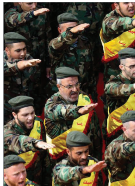
شبه‌نظامیان حزب‌الله لبنان