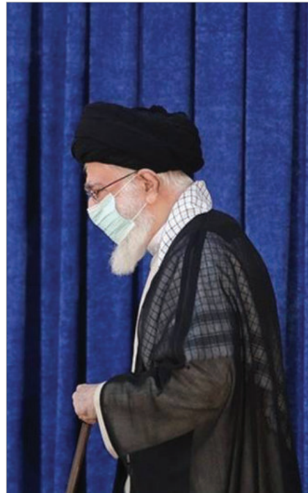
سخنرانی خامنه‌ای در مقبره روح‌الله خمینی

مشورت می‌دهند آنها هم طبق مشورت اینها عمل می‌کنند و شکست می‌خورند. یکی از مشورت‌های این مشاورین خائن آنست که به اربابان خود می‌گویند برای مقابله با