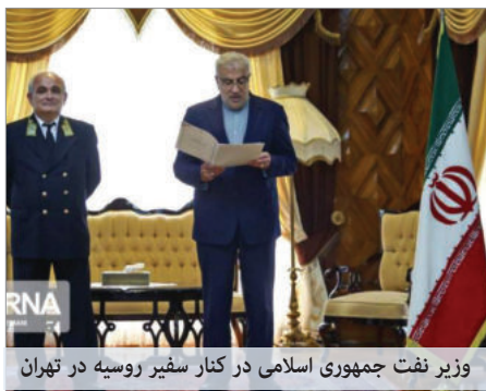
وزیر نفت جمهوری اسلامی در کنار سفیر روسیه در تهران

خطابه‌خوانی جواد اوجی وزیر نفت جمهوری اسلامی در کنار لوان جاگاریان سفیر روسیه که دست پشت کمر ایستاده و پوزخند می‌زند و پاسدارها و ارتشی‌هایی که به صف شدند تا به وی ادای احترام کنند، ذلت تمام‌عیار