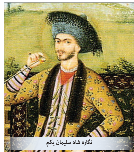
نگاره شاه سلیمان یکم

ملا محمدباقر فرزند ملا محمدتقی مجلسی است که او نیز هرچند از شاگردان شیخ بهائی و در زمره علمای بزرگ عصر خود بود اما چون مشرب صوفیانه داشت در زمانی که جانشینان شاه عباس متصوفه را به حاشیه رانده و با متشرعین گرم گرفته بودند، از نفوذ چندانی برخوردار نبود. ملا محمدباقر برعکس، برای کسب نفوذ و اقتدار، نه‌تنها با صوفیان به مبارزه برخاست بلکه کوشید پدرش را نیز از تهمت صوفیگری مبرا کند. او در رساله «اعتقادات» که می‌گوید یک شبه تألیف کرد، می‌نویسد: «مبادا گمان بد کسی به پدرم نماید که او از صوفیه است بلکه چنین نیست زیرا که من معاشر با پدرم بودم، سرّاً و جهراً (پنهان و آشکار) و از احوال عقاید او مطلع بودم، بلکه پدرم صوفیه را بد می‌دانست لیکن در بدو امر چون صوفیه نهایت غلّو داشتند پس پدرم به سلک ایشان منسلک شد تا به این وسیله دفع و رفع و قلع و قمع اصول این شجره خبیثه زقومیه نماید و