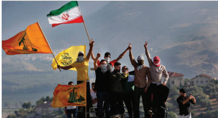
پرچم جمهوری اسلامی در دست اعضای حزب‌الله در جریان اعتراض در مرز لبنان و اسرائیل، ۱۴ مه ۲۰۲۱