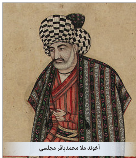
آخوند ملا محمدباقر مجلسی

مجلسی، صوفی ستیزی را نیز بر سنی ستیزی افزود. مؤلف «فوائدالصوفیه» می‌نویسد «جمع مشایخ صوفیه را از اصفهان بیرون کردند... و از باقی ممالک محروسه نیز آنچه صوفیه و مریدانشان بودند به‌در کردند... در کارخانه‌های کوزه‌گران، هر جا سبوی دهن‌تنگی به‌نظر شاگردان ملا محمدباقر درآمد شکستند و تأویلش چنان کردند که در هنگام وزیدن باد از دهن کوزه‌ها آواز «هو» برمی‌آید و این آواز یاهو زدن شیوه صوفیان است. در عهد آن حضرت