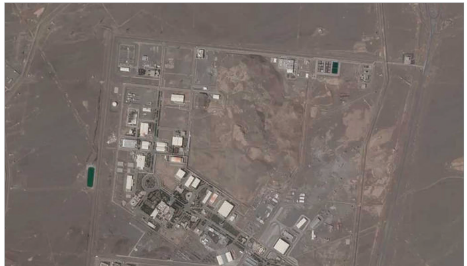
تصویر ماهواره‌ای تأسیسات اتمی نطنز مربوط به ۱۴ آوریل ۲۰۲۱

● نکته قابل توجه این است که گزارش آژانس اطلاعات داخلی آلمان تلاش‌های رژیم ایران در سال ۲۰۲۱ را در بر می‌گیرد یعنی درست زمانی که ایالات متحده بر اساس سیاست‌های دولت بایدن و دیگر قدرت‌های جهان امتیازات بزرگی به تهران ارائه کردند تا زمامداران رژیم اسلامی در ایران را قانع کنند که برنامه تسلیحات اتمی خود را متوقف کند! ● پروفیسور ماتیبو کرونیگ از دانشگاه جرج تاون: رژیم ایران چند هفته تا دستیابی به بمب اتم فاصله دارد. ما باید اقدامی انجام دهیم وگرنه ایران برای همیشه به یک قدرت هسته‌ای تبدیل خواهد شد. ● اداره تحقیقات گمرک آلمان (ZKA) تحقیقاتی را علیه یک شهروند آلمانی ایرانی‌تبار در شهر «نوردرشت» در حوالی هامبورگ به ظن نقض قانون تجارت خارجی در سه پرونده تجاری آغاز کرد. گفته می‌شود وی در تهیه تجهیزات آزمایشگاهی مربوط به برنامه‌های هسته‌ای و موشکی ایران دست داشته است.