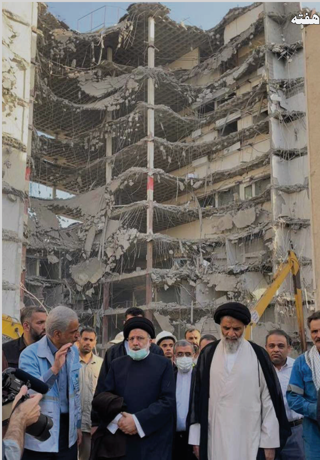
سیدابراهیم رئیسی معروف به «قاضی مرگ» در برابر ویرانه و آوار متروپل / آبادان/ ۱۳ خرداد ۱۴۰۱