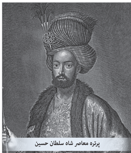
پرتزه معاصر شاه سلطان حسین

آخوند ملا محمدباقر مجلسی کشف و کراماتی به خودش نیز نسبت می‌دهد. تنکابنی مؤلف «قصص‌العلماء» در شرح کرامات وی می‌نویسد «نقل شده است از خط آخوند ملامحمدباقر که به این عبارت نوشته است که چنین گوید: بنده خاطی محمدباقر بن محمدتقی که شبی از شبهای جمعه در ادعیه خود مرور می‌کردم، نظرم به دعای