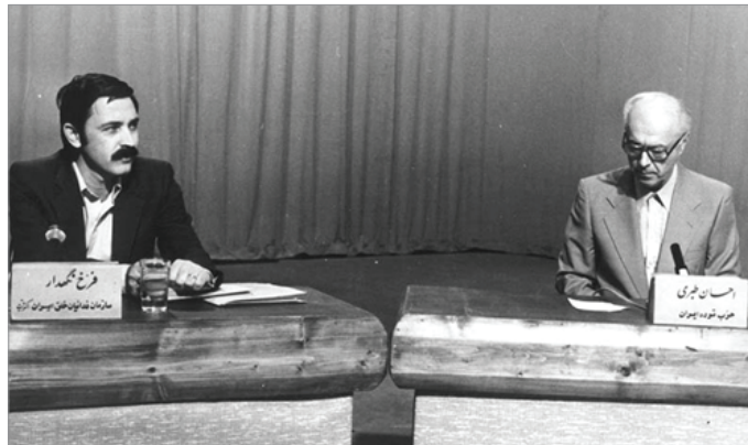
مناظره های احسان طبری در ابتدای انقلاب

ضد انقلاب - امپریالیسم آمریکا و عمالش - هدایت نمائید. انقلاب ایران و کلیه مردم زحمتکش ایران به وجود شما، به رهبری قاطع و بی تزلزل شما، به خط امام خود، نیاز حیاتی دارند صادقانه امیدواریم که سالهای سال موهبت سلامت و فعالیت پر ثمر شما ارزانی انقلاب و مردم ایران باشد. باتقدیم دروهای صادقانه و آرزوی صمیمانه تندرستی.