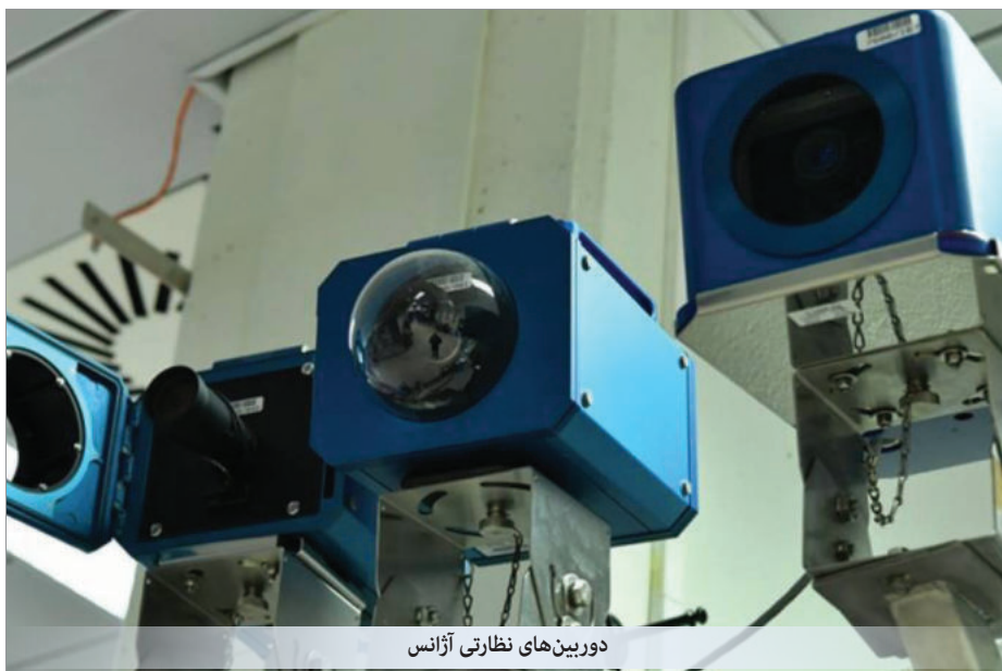
دوربین‌های نظارتی آژانس

سازمان انرژی اتمی جمهوری اسلامی اعلام کرده