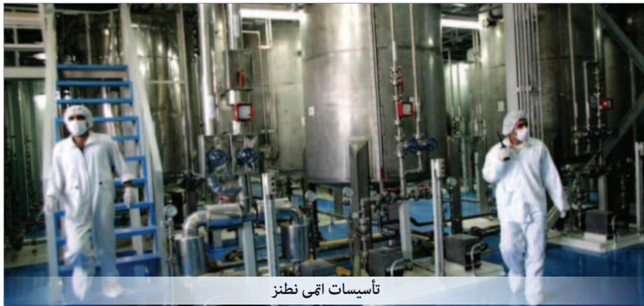
تأسیسات اتمی نطنز

و قول داد که تشدید تنش‌ها بین اسرائیل و ایران «تأثیری بر فعالیت بازرسان آژانس نداشته است». وی افزود: «تصمیم گرفتیم که اجازه ندهیم بازرسان تا زمانی که اوضاع کاملاً آرام نشده است بازگردند.»