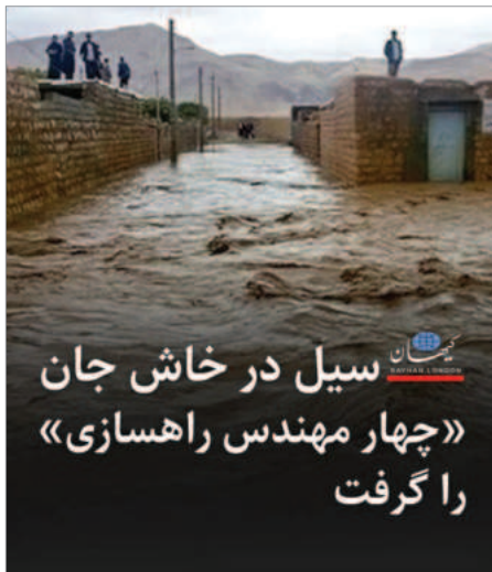
سیل در خاش جان «چهار مهندس راهسازی» را گرفت

«رکتا» سه‌شنبه ۲۸ فروردین ۱۴۰۳ در خبری نوشت که به دنبال راه افتادن سیلاب در منطقه «کارواندر» شهرستان