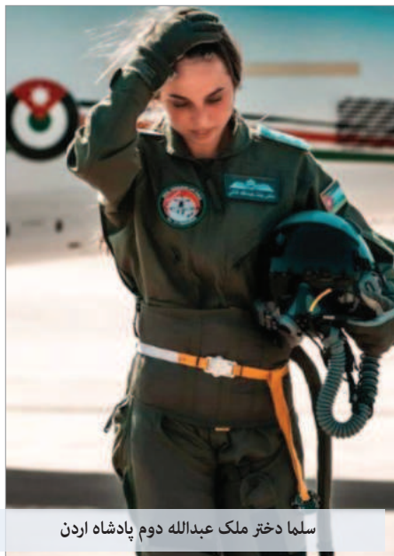
سلما دختر ملک عبدالله دوم پادشاه اردن

در داخل حکومت جریان‌هایی که واقع‌گرایی بیشتری نسبت به مسائل دارند در مورد همکاری دولت‌های خارجی و منطقه‌ای با اسرائیل در رویارویی با حملات سپاه هشدار دادند. روزنامه «جمهوری اسلامی» چاپ تهران ۲۷ فروردین‌ماه در مقاله‌ای با اشاره به این حملات نوشت، «دو نکته در این میان بیش از سایر نکات قابل تأمل هستند. یکی اینکه آمریکا، فرانسه، انگلیس و بعضی از کشورهای منطقه اعلام کردند برای ردگیری پهپادها و موشک‌های ایرانی و جلوگیری از اصابت آنها به اهداف مورد نظر فعال بوده‌اند و به اسرائیل در این زمینه کمک کرده‌اند. نکته دیگر اینکه هیچ‌یک از دولت‌ها و مجامع بین‌المللی در واکنش‌هایشان به این واقعیت که وجود رژیم صهیونیستی عامل بروز تشنج در منطقه خاورمیانه است کوچک‌ترین اشاره‌ای نکرده‌اند.»