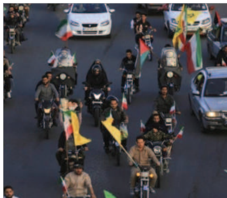
کاروان شادی حزب اللهی‌ها بعد از حمله سپاه پاسداران به اسرائیل / فروردین ۱۴۰۳