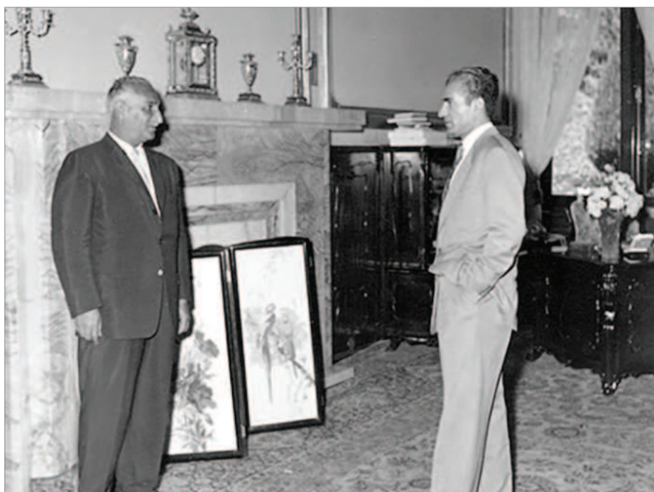
محمد رضا شاه پهلوی به اتفاق حبیب ثابت در دفتر کار خود

شمار کامیون و اتوبوسی که در داخل کشور تولید کردیم به حد کافی رسید، صرف می‌کند که موتور این کامیونها و اتوبوسها را در داخل کشور تولید بکنیم، که کردیم. یعنی موتور مرسدس بنز را بردیم در تبریز شروع کردیم ←