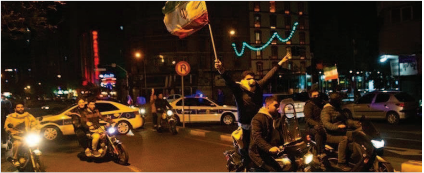
جشن حزب‌اللهی‌ها پس از موشک‌پرانی سپاه پاسداران انقلاب اسلامی به اسرائیل / یکشنبه ۲۶ فروردین ۱۴۰۳