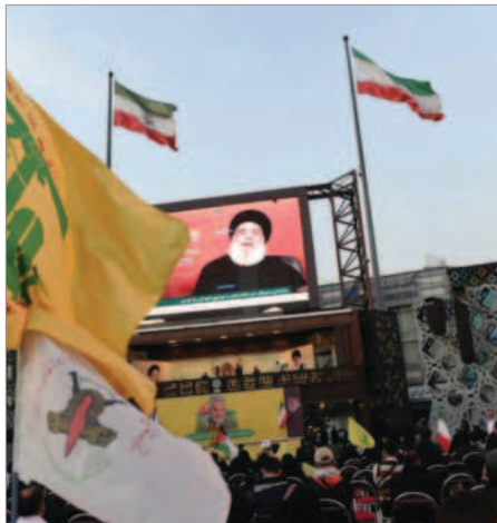
پخش صحبت‌های حسن نصرالله دبیرکل حزب الله لبنان در تهران در باره جنگ غزه / آبان ۱۴۰۲