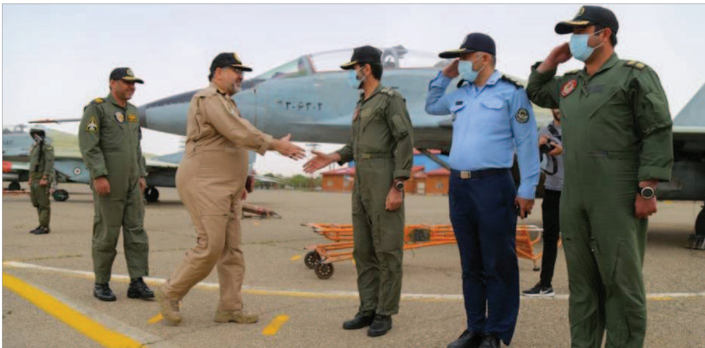
بازدید حمید واحدی فرمانده نیروی هوایی ارتش جمهوری اسلامی با شکم چاق و پرواز از پایگاه تبریز / اردیبهشت ۱۴۰۱

● از سوی دیگر محمد آصفری نماینده مجلس شورای اسلامی در پاسخ به اینکه در صورت حمله متقابل اسرائیل به تأسیسات نفتی و زیرساخت‌ها، جمهوری اسلامی چه امکانی را در پاسخ هدف قرار خواهد داد، برخلاف همه‌ی