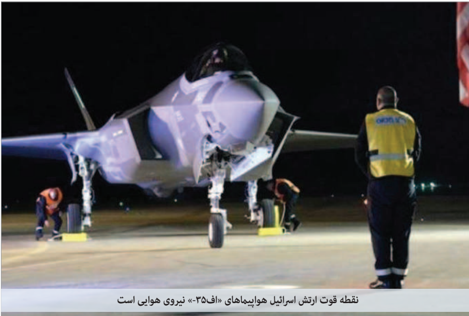
نقطه قوت ارتش اسرائیل هواپیماهای «اف-۳۵» نیروی هوایی است

جداگانه دیدگاه‌های خود را در مورد اقدامات احتمالی علیه رژیم ایران بیان کرده‌اند. هزری هالوی رئیس ستاد کل ارتش اسرائیل با حضور در پایگاه نیروی هوایی «نوتیم» گفت که اسرائیل به حمله موشکی و پهپادی جمهوری اسلامی واکنش نشان خواهد داد. او افزود «در حال بررسی گام‌های خود هستیم». وی اضافه کرد رژیم «ایران می‌خواست به توانایی‌های استراتژیک دولت اسرائیل آسیب برساند».