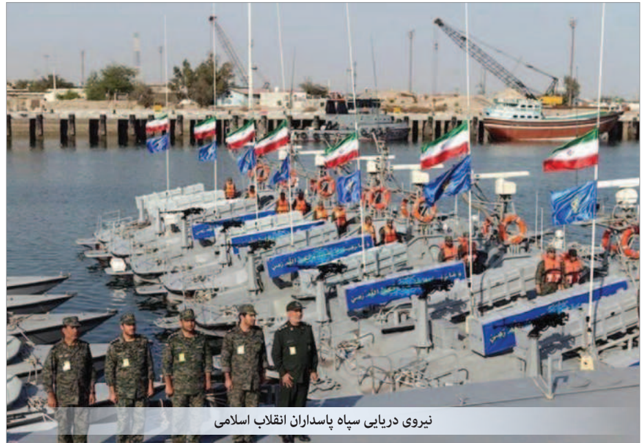
نیروی دریایی سپاه پاسداران انقلاب اسلامی

بریتانیا از همه طرفین خواسته برای جلوگیری از تشدید تنش گام بردارد و خواستار اجرای کامل قطعنامه‌های شورای امنیت شده است.