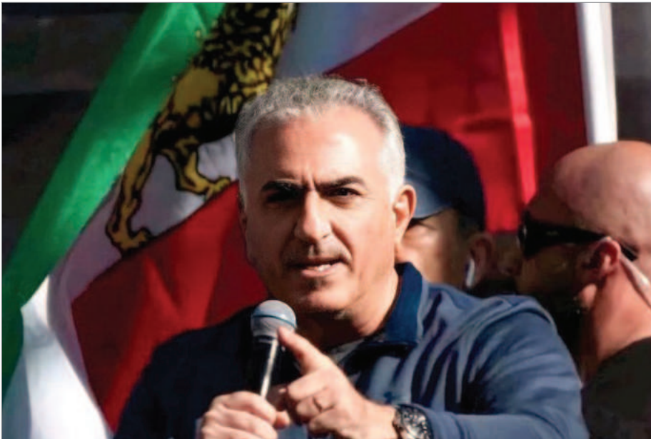
شاهزاده رضا پهلوی / تظاهرات لس آنجلس / یکشنبه ۲۲ بهمن ۱۴۰۱

ملت و مملکت نیست و به مردم اهمیتی نمی‌دهد و فقط به فکر صادر کردن ایدئولوژی خود به سایر نقاط جهان است... برای همین هم هست که در چند دهه اخیر فقط شُرّ پیا کرده است.»