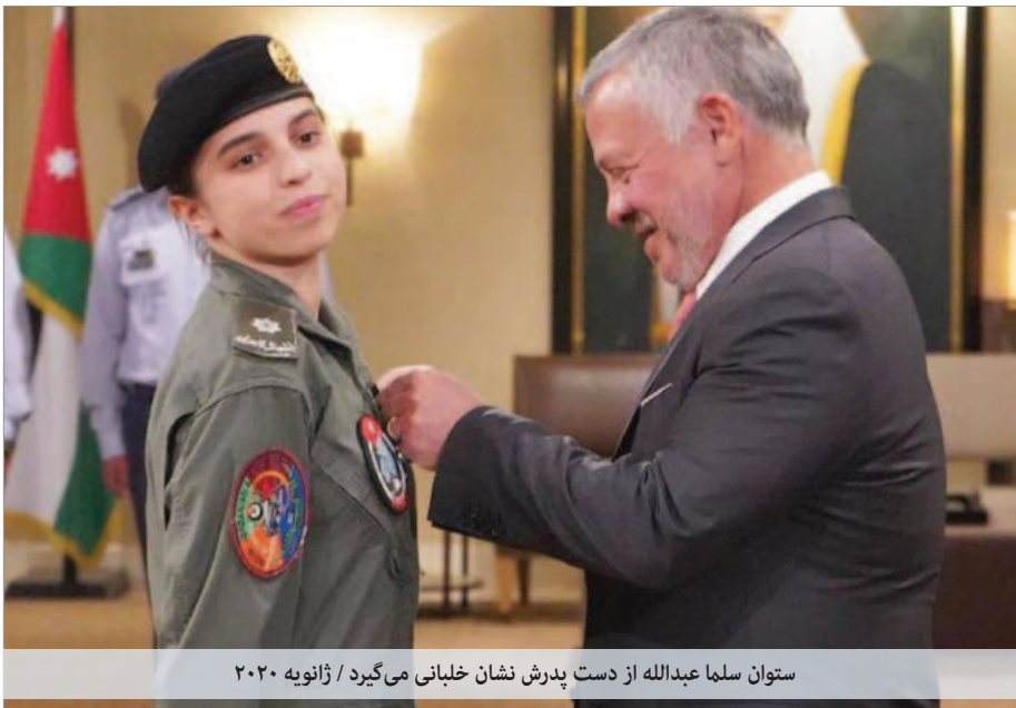
ستوان سلما عبدالله از دست پدرش نشان خلبانی می‌گیرد / ژانویه ۲۰۲۰

گزارش‌ها در مورد حضور سلما عبدالله دختر عبدالله دوم پادشاه اردن در عملیات رهگیری موشک‌ها و پهپادهایی که