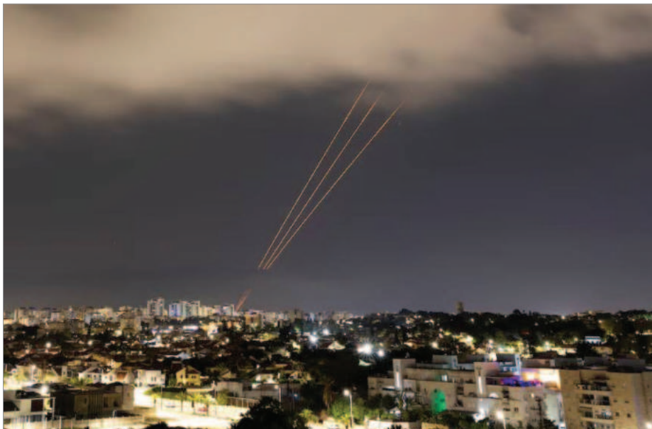
فعال شدن یک سیستم ضد موشکی پس از پرتاب پهپادها و موشک‌های جمهوری اسلامی به سمت اسرائیل در شهر اشکلون در ۱۴ آوریل ۲۰۲۴

جشن و شادی هواداران نظام در تهران «میدان فلسطین» پس از حمله به اسرائیل بعد از حمله سپاه پاسداران به اسرائیل طرفداران حکومت در چند شهر از خوشحالی به خیابان‌ها آمدند و جشن گرفتند.