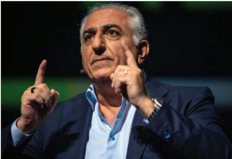
شاهزاده رضا پهلوی

(نوفدی)، اعدام‌ها در ایران، هزینه‌های نظامی رژیم و پیشرفت تسلیحات هسته‌ای آن همگی بطور قابل توجهی افزایش یافته زیرا دولت‌های تحت رهبری اوباما و بایدن بجای به چالش کشیدن رژیم، با آن مماشات کرده‌اند.