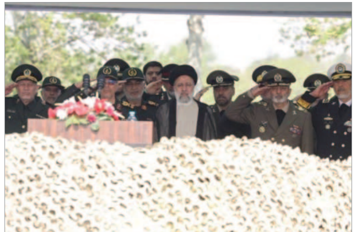
سخنرانی ابراهیم رئیسی در مراسم رژه «روز ارتش» / ۲۹ فروردین ۱۴۰۳

است که همزمان با افزایش تنش‌ها میان رژیم و اسرائیل، مأموران نیروی انتظامی و لباس‌شخصی‌ها در کنار «گشت ارشاد» در نقاط پرتردد شهرهای مختلف مستقر شده‌اند. گویی رژه ارتش جمهوری اسلامی بیشتر برای ترساندن مردم بود تا نمایش اقتدار پوشالی رژیم که با موشک‌پرانی‌های اخیر به اسرائیل بیش از پیش نمایان و ثابت شد و آن را با هیچ تبلیغات شفاهی و لفظی توسط مقامات و رسانه‌های وابسته نمی‌توان لاپوشانی کرد.