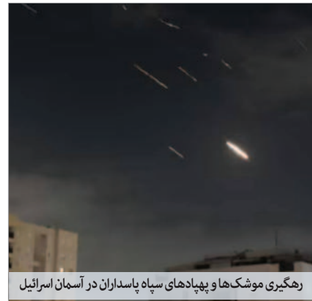
رهگیری موشک‌ها و پهپادهای سپاه پاسداران در آسمان اسرائیل

سرخسنگوی ارشد نیروهای مسلح تهدید کرد، «به سران کشورهای آمریکا، انگلیس، فرانسه و آلمان یادآوری می‌کنیم دست از حمایت رژیم رو به زوال اسرائیل شورو، قانون‌شکن، تروریست و کودک‌کش بردارید، شما خوب می‌دانید جمهوری اسلامی ایران ثابت کرده است جنگ طلب نبوده است و به دنبال گسترش جنگ نیز نیست.»