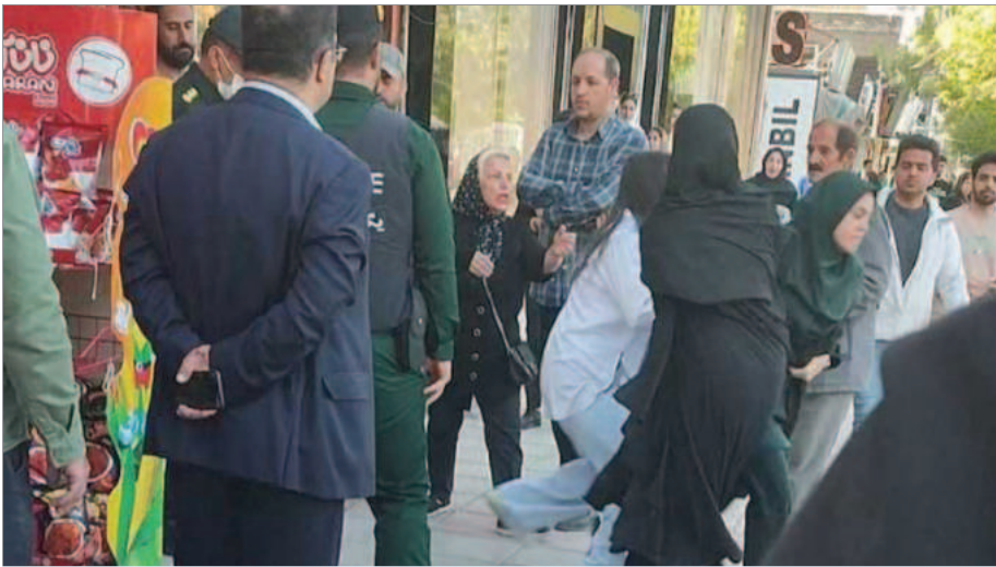
شمار زیادی از شهروندان با اجرای طرح «حجاب و عفاف» توسط مأموران حکومت بازداشت شدند

رعایت نمایند. نیروی انتظامی قم همچنین تهدید کرده که «ناگزیر» و «بر اساس وظایف خویش، با اندک ناقضان قانون حجاب و عفاف برخورد قانونی می‌کند.»