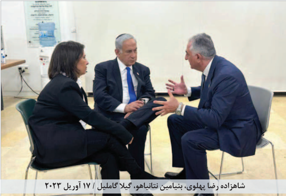
شاهزاده رضا پهلوی، بنیامین نتانیاهو، گیلا گاملیل / ۱۷ آوریل ۲۰۲۳

پول‌های بلوکه شده را آزاد می‌کنید، حکومت از آن برای تأمین تسلیحات و تأمین مالی شبه‌نظامیان و تجهیز آنها با تسلیحات استفاده می‌کند، بنابراین رژیم قدرتمندتر می‌شود. خیلی وقت پیش گفتم، آن زمانی که از اسرائیل بازدید کردم تمام حرف و صحبتیم با رهبران اسرائیل و سایر دنیا همین بود... اگر شما اجازه بدهید رژیم روی مماشات شما و همچنین رشوه‌هایی که بابت گروگان‌ها می‌گیرد حساب کند و یا تحریم‌ها را کامل اجرا نکنید همین‌ها باعث می‌شود که میلیاردها دلار پول به جیب بزنند. همه اینها رابطه مستقیم با هم دارند. وقتی برای صادرات برق به عراق به آنها میلیون‌ها دلار پول می‌رسد جز همین کارهایی که الان انجام می‌دهند، چه انتظار دیگری دارید؟»