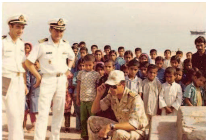
دیدار ناوروان شهریار شفیق با کودکان جزیره ابوموسی / آذر ۱۳۵۰

از آنجا که کیفیت پهپادها و موشک‌های ساخت جمهوری اسلامی پایین است سابقه سقوط آنها روی خانه‌ها و املاک مردم یا مزارع کشاورزی هم ایران و هم کشورهای مسیر زیاد است. چنانکه در جریان حمله اخیر به اسرائیل نیز چند فروند از آنها در داخل خاک ایران از جمله روستاهای حوالی