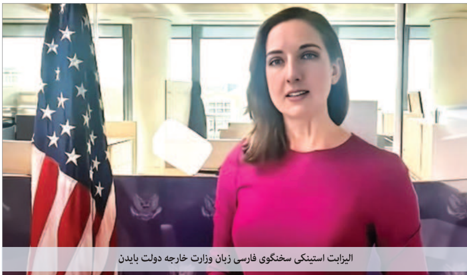
الیزابت استینکی سخنگوی فارسی زبان وزارت خارجه دولت بایدن

و کشتیرانی نظارت دارد اما آیا راهی برای کنترل انتقال تسلیحات غیرقانونی از طریق هوایی به گروه‌های نیابتی یا از مسیر دریای کاسپین به روسیه وجود ندارد؟