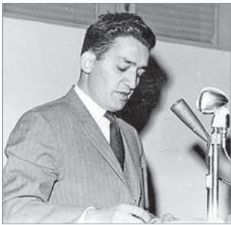
سیاست و سیاستگذاری اقتصادی در ایران