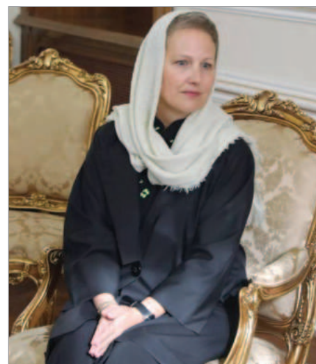
نادین اولویویه ری سفیر سوئیس در تهران

● مجتبی ابطی دستیار احمد وحیدی وزیر کشور می‌گوید بعد از حمله موشکی و پهپادی از ایران به اسرائیل به آمریکا پیام ارسال شد که اگر آمریکایی‌ها کوچکترین اقدامی انجام دهند، کل منطقه روی سرشان خراب می‌شود! ● وی ادعا کرد بعد از پایان عملیات، ساعت سه بامداد سفیر سوئیس به عنوان حافظ منافع آمریکا در ایران بجای وزارت خارجه به سپاه احضار شد که «دیپلماسی نظامی» بود و هشدارهای لازم به وی داده شد! ● پیش از این حسین امیرعبداللہیان وزیرخارجه جمهوری اسلامی گفته بود سفیر سوئیس به عنوان «حافظ منافع آمریکا» در ایران به وزارت خارجه احضار شده است.