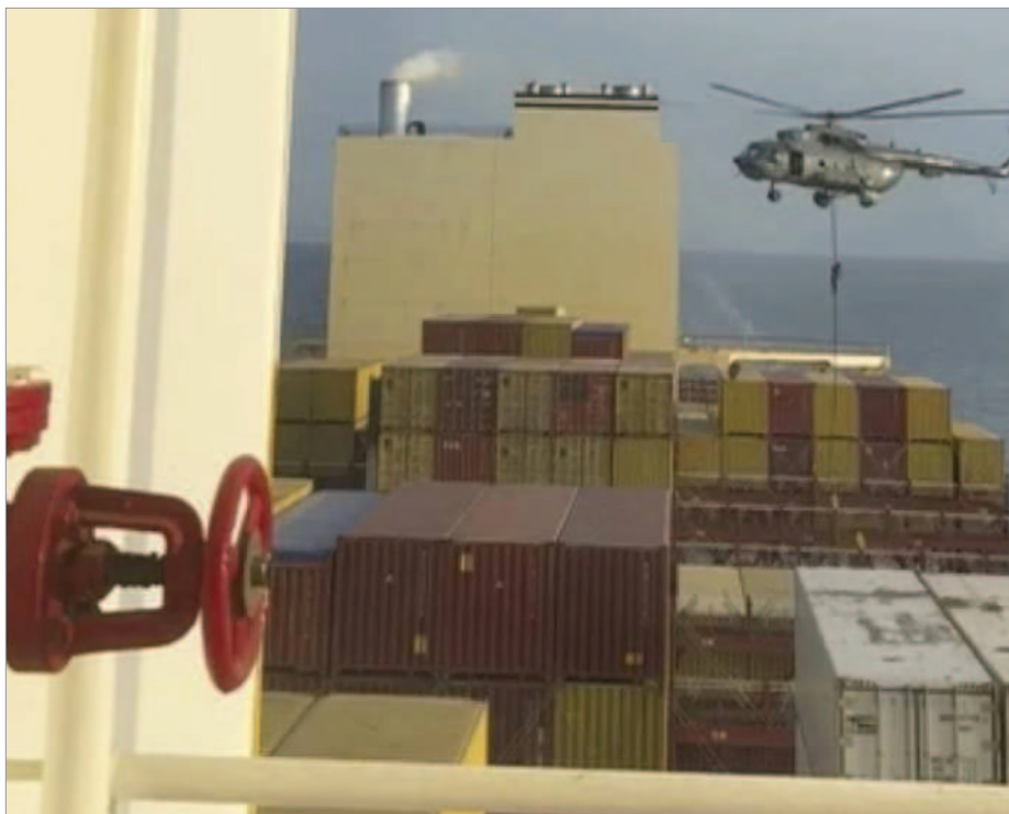
هلیکوپتری که گفته می‌شود متعلق به سپاه پاسداران است در نزدیک تنگه هرمز روی عرشه یک کشتی نیرو پیاده کرد

امارات نزدیک دریای عمان و تنگه هرمز مورد حمله قرار گرفت. یکی از خدمه کشتی شنیده که افراد مسلح به آنها اخطار داده‌اند: «بیرون نیا» و سپس از بقیه افراد مسلح می‌خواهد که آرایش بگیرند. آسوشیتدپرس می‌نویسد، به نظر می‌رسد هلیکوپتر مورد استفاده مربوط به سپاه پاسداران بوده که در گذشته نیز به همین روش روی عرشه کشتی‌ها نیرو پیاده کرده است. این کشتی که به دست نیروهای سپاه افتاده احتمالاً کشتی «MSC Aries» با پرچم پرتغال است. این کشتی کانتینری مرتبط با شرکت Zodiac Maritime مستقر در لندن است که در زیرمجموعه Eyal Ofer's Zodiac Group قرار دارد. ایال عوفر مالک میلیاردر این شرکت یک شهروند اسرائیلی است. شرکت زویاک از اظهار نظر در اینباره خودداری کرده است. کشتی تجاری «گالکسی لیدر» که مالک آن نیز یک اسرائیلی است ۲۷ آبان‌ماه ۱۴۰۲ به همراه ۲۵ خدمه در دریای سرخ توسط حوثی‌ها با همین روش توقیف شد. کشتی آریس با ۲۰ خدمه فیلیپینی عازم هندوستان بود اما مشخص نیست به کجا منتقل شده است. توقیف کشتی‌های تجاری با هلی‌برن (پیاده کردن کماندوها با هلیکوپتر) روشی است که سپاه پاسداران با همکاری ارتش جمهوری اسلامی در چند مورد برای توقیف کشتی‌های خارجی در آب‌های منطقه استفاده کرده است.