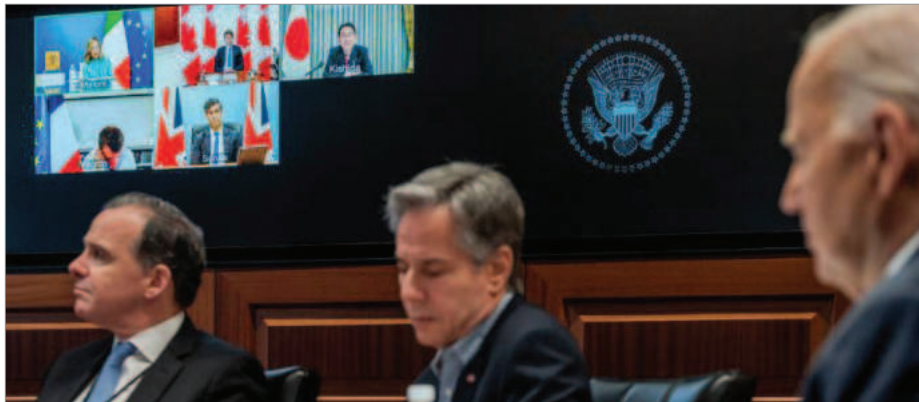
جو بایدن رئیس جمهوری و آنتونی بلینکن وزیر خارجه آمریکا در نشست گروه هفت که به صورت آنلاین برگزار می‌شود / فروردین ۱۴۰۳

بنیامین نتانیاهو نخست‌وزیر اسرائیل گفته از هیچ حمله متقابل اسرائیل علیه ایران حمایت نخواهد کرد با اینهمه بایدن با اشاره به تماس تلفنی اخیرش با نتانیاهو که پس از حمله انجام شد، بر «تعهد آهنگین آمریکا به امنیت اسرائیل» تأکید کرد و گفت، «به او [نتانیاهو] گفتم که اسرائیل برای دفاع در برابر حملات چه بسا بی‌سابقه و شکست آنها توانایی قابل توجهی از خود نشان داد [و از این طریق] پیامی آشکار به دشمنانش فرستاد مبنی بر اینکه آنها نمی‌توانند امنیت اسرائیل را بطور جدی تهدید کنند.»