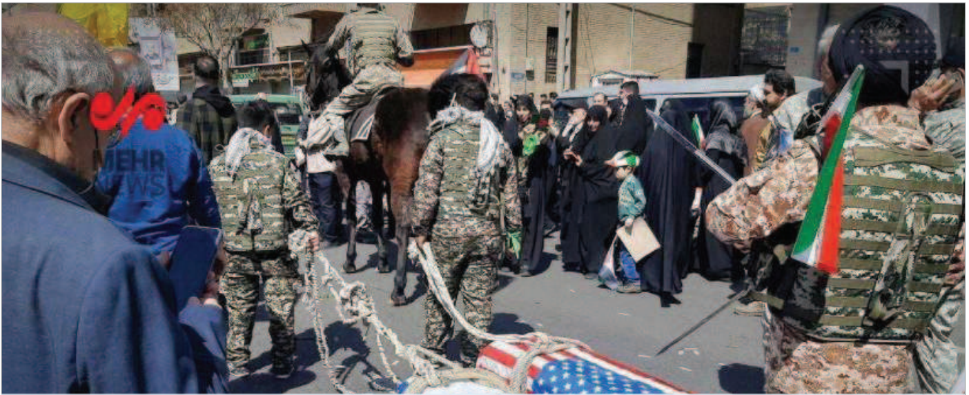
هواداران نظام تابوت اسرائیل و آمریکا را روی زمین می‌کشند!

تا زمانی که شورای امنیت اقدام لازم برای حفظ صلح و امنیت بین‌المللی را به عمل آورد، هیچیک از مقررات این منشور به حق ذاتی دفاع از خود خواه فردی یا دستجمعی لطمه‌ای وارد نخواهد کرد. اعضاء باید اقداماتی را که در اعمال این حق دفاع از خود به عمل می‌آورند فوراً به شورای امنیت گزارش دهند. این اقدامات به هیچ وجه در اختیار و مسئولیتی که شورای امنیت بر طبق این منشور دارد و به موجب آن برای حفظ و اعاده صلح و امنیت بین‌المللی و در هر موقع که ضروری تشخیص دهد اقدام لازم به عمل خواهد آورد تأثیری نخواهد داشت.