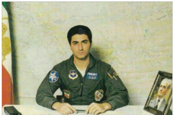
دیدار ناوروان شهریار شفیق با کودکان جزیره ابوموسی / آذر ۱۳۵۰

پاسداران و همچنین شماری از رسانه‌ها و کاربران عرب ضداسرائیلی مورد حملات لفظی زیادی قرار گرفتند. همزمان وزارت خارجه جمهوری اسلامی و اردن