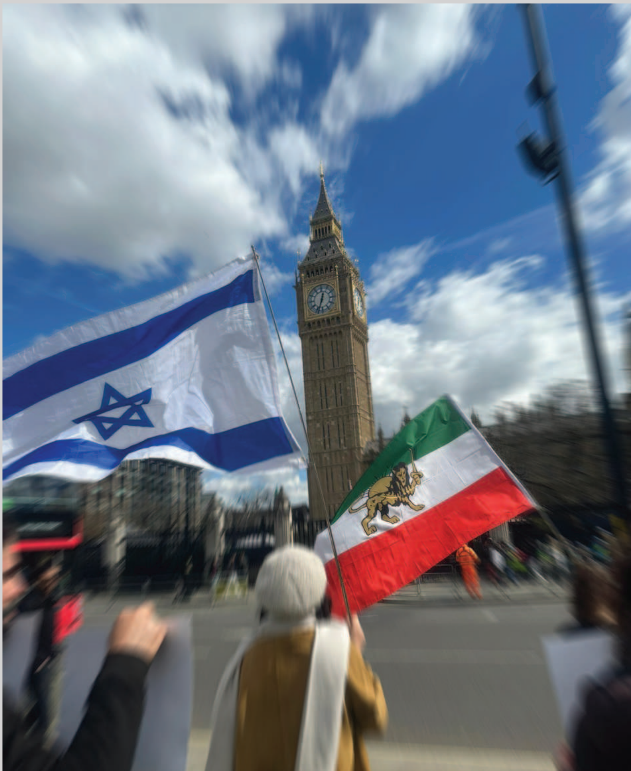
عکس هفته | دو ملت ایران و اسرائیل یک دشمن مشترک دارند: جمهوری اسلامی! تجمع همبستگی دو ملت در لندن که توسط «صحنه‌ی آزادی» روز چهارشنبه ۲۹ فروردین ۱۴۰۳ برگزار شد.