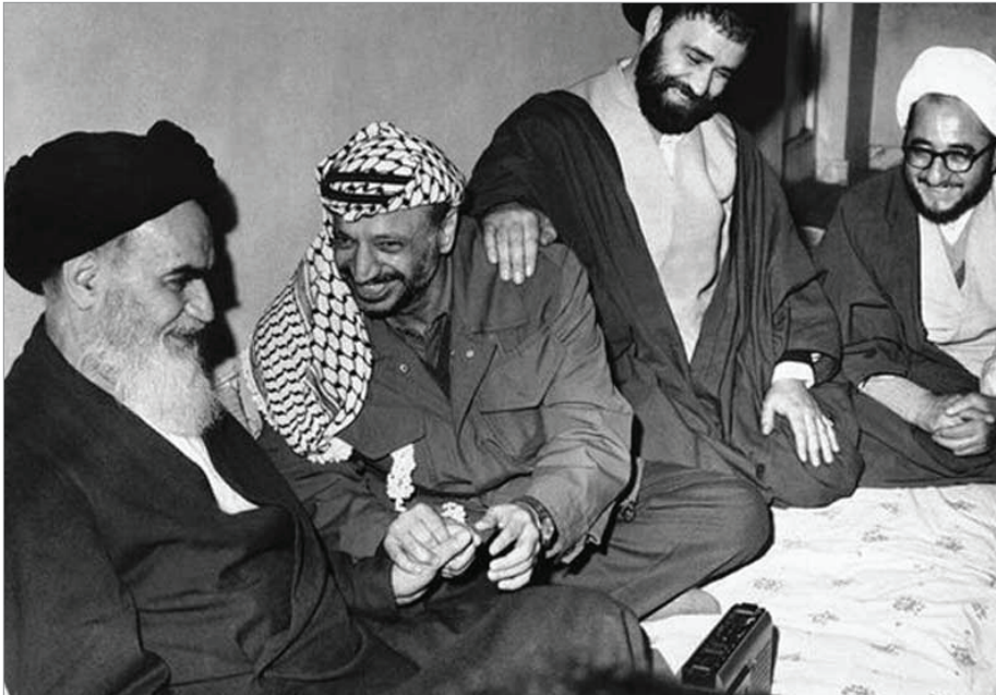
خمینی، عرفات، احمد خمینی، صادق خلخالی

اجباری اسلامی هم پیش رفت. رواداری نسبت به یهودیان ایرانی برای قرن‌ها بخشی از فرهنگ و سنت ایرانیان بود. جامعه یهودیان ایران کهن‌ترین جامعه یهودی تمام خاورمیانه است و ریشه‌های آن به ملکه استر، همسر خشایارشا هخامنشی، نوهی کوروش کبیر می‌رسد. سرگذشت ملکه استر در تورات، کتاب مقدس یهودیان، روایت شده است. به لطف خشایارشا هخامنشی، آوارگان یهودی از مرگ و قتل عام نجات پیدا کردند. یهودیان هرساله این رویداد را در «جشن پوریم» گرامی می‌دارند. داستان ملکه استر نشان‌دهنده این حقیقت است که جامعه یهودیان در ایران تا چه اندازه ریشه‌دار و کهن است. محمدرضا شاه پهلوی در این مورد هم به میراث تاریخ ایران وفادار بود. دو سال پس از تشکیل دولت اسرائیل (۱۹۴۸)، در سال ۱۹۵۰ دولت شاهنشاهی ایران کشور اسرائیل را به رسمیت شناخت و تا پایان، روابط خوب خود را با این کشور حفظ کرد. در حقیقت، ایران و اسرائیل متحد بودند. نه فقط متحد‌های ظاهری در زیر چتر بلوک غرب در دوران جنگ سرد، بلکه متحد در راستای اهداف و منافع مشترک: نیروهای ضد اسرائیلی و گروه‌هایی که قصد سرنگون کردن شاه را داشتند اغلب با هم همدست بودند و با یکدیگر همکاری داشتند، به ویژه در کمپ‌های آموزش تروریستی در لبنان.