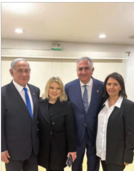
جناب آقای بنیامین نتانیاهو، نخست وزیر محترم اسرائیل،

از فوریه شوم ۱۹۷۹ و عقبگرد تاریخی ایران از تمام دستاوردهای درخشان حکومت پهلوی، تهدید موجودیت اسرائیل و نفرت پراکنی علیه یهودیان جزئی جدایی‌ناپذیر از ذات رژیم تبهکار حاکم بر ایران بوده است. اما از ۷ اکتبر ۲۰۲۳، دنیا شاهد است که یهودستیزی و اسرائیل‌ستیزی جمهوری اسلامی وارد بعد تازه و خطرناکتری شده است. برخی از تحلیلگران و ناظران واقعی صحنه سیاسی ایران، بارها هشدار داده بودند که اگر غرب سیاست مماشات با این رژیم تروریستی را پایان ندهد، اتفاقاتی نظیر آنچه در چند روز گذشته رخ داده را شاهد خواهیم بود. از آن جمله می‌توان به نامه‌هایی که برخی از اعضای کنونی حزب ایران نوین به باراک اوباما (۹ نوامبر ۲۰۱۱)، دانلد ترامپ (۲۴ دسامبر ۲۰۱۶)، امانوئل مکرون، اولاف شولتس، و بوریس جانسون (۲۱ فوریه ۲۰۲۲)، و البته به نفتالی بنت (۸ ژوئیه ۲۰۲۱) ارسال کرده بودند، اشاره کرد.