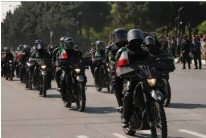
رژه یگان‌های موتور پلیس ضدشورش