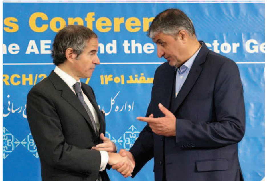
کنفرانس مطبوعاتی محمد اسلامی و رافائل گروسی در تهران / اسفند ۱۴۰۱

جمهوری اسلامی در حالی خود را آماده مذاکرات سازنده نشان می‌دهد که پس از افزایش میزان غنی‌سازی اورانیوم در تأسیسات اتمی نطنز و فردو، دولت‌های غربی اعلام کردند که احتمال فعال شدن «مکانیسم ماشه» وجود دارد. امانوئل ماکرون رئیس‌جمهوری فرانسه اخیراً هشدار داده است که فعالیت‌های غنی‌سازی جمهوری اسلامی به «نقطه‌ای خطرناک و غیرقابل بازگشت» نزدیک شده است. او از شرکای اروپایی عضو برجام خواست تا در صورت عدم پیشرفت در مذاکرات، بازگشت تحریم‌ها را مورد بررسی قرار دهند.