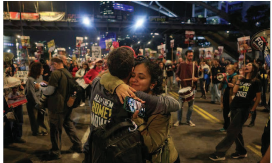
خانواده گروگان‌های اسرائیلی امیدوارند پس از توافق با حماس عزیزانشان به خانه بازگردند

اساس اطلاعات اسرائیل، تقریباً نیمی از این گروگان‌ها، از جمله سه آمریکایی، به احتمال زیاد زنده‌اند. اگرچه اسرائیل و حماس رسماً توافق را اعلام نکرده‌اند، اما شبکه NBC گزارش داده است که با اسم نعیم از مقامات ارشد حماس تأیید کرده است که این گروه به توافق پایبند است. ترامپ تهدید کرده بود که اگر حماس گروگان‌ها را تا زمان مراسم سوگند او آزاد نکند، «جهنم بپا خواهد شد.» پایگاه خبری «آکسیوس» به نقل از «منابع مطلع» گزارش داد، در مرحله اول ۳۳ گروگان آزاد خواهند شد که شامل زنان، کودکان، مردان بالای ۵۰ سال و مردان زخمی و بیمار زیر ۵۰ سال هستند. حماس هنوز اطلاعاتی درباره وضعیت این ۳۳ گروگان ارائه نکرده، اما ارزیابی اسرائیل این است که اکثر آنها زنده هستند.