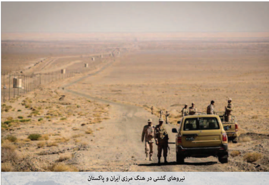
نیروهای گشتی در هنگ مرزی ایران و پاکستان

روبرو هستند. پس از سرکوب گسترده مردم در جریان خیزش ضدحکومتی ۱۴۰۱ و «جمعه خونین» زاهدان وضعیت این شهر و سایر شهرستان‌های استان سیستان و بلوچستان به شدت امنیتی شده است. درگیری‌های مداوم میان نیروهای امنیتی با گروه‌های مسلح، افزایش درگیری‌های پادگانی و ناامنی جاده‌ها حاصل سیاست‌های تبعیض‌آمیز حکومت به ویژه در استان‌های مرزی و محروم است.