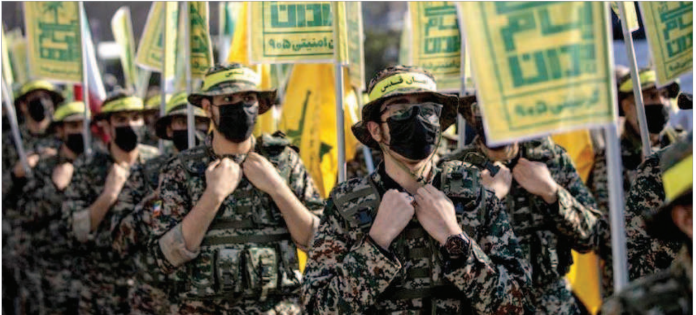
رزمایش «راهیان قدس» / تهران دی ماه ۱۴۰۳

روزنامه شرق را «داستانسرای» دانست و نوشت: «برخی در داخل با تولید اخبار جعلی، خط دشمن برای تضعیف رزمایش مهم وحدت آفرین و دشمن شکن «راهیان قدس» را دنبال می‌کنند.»