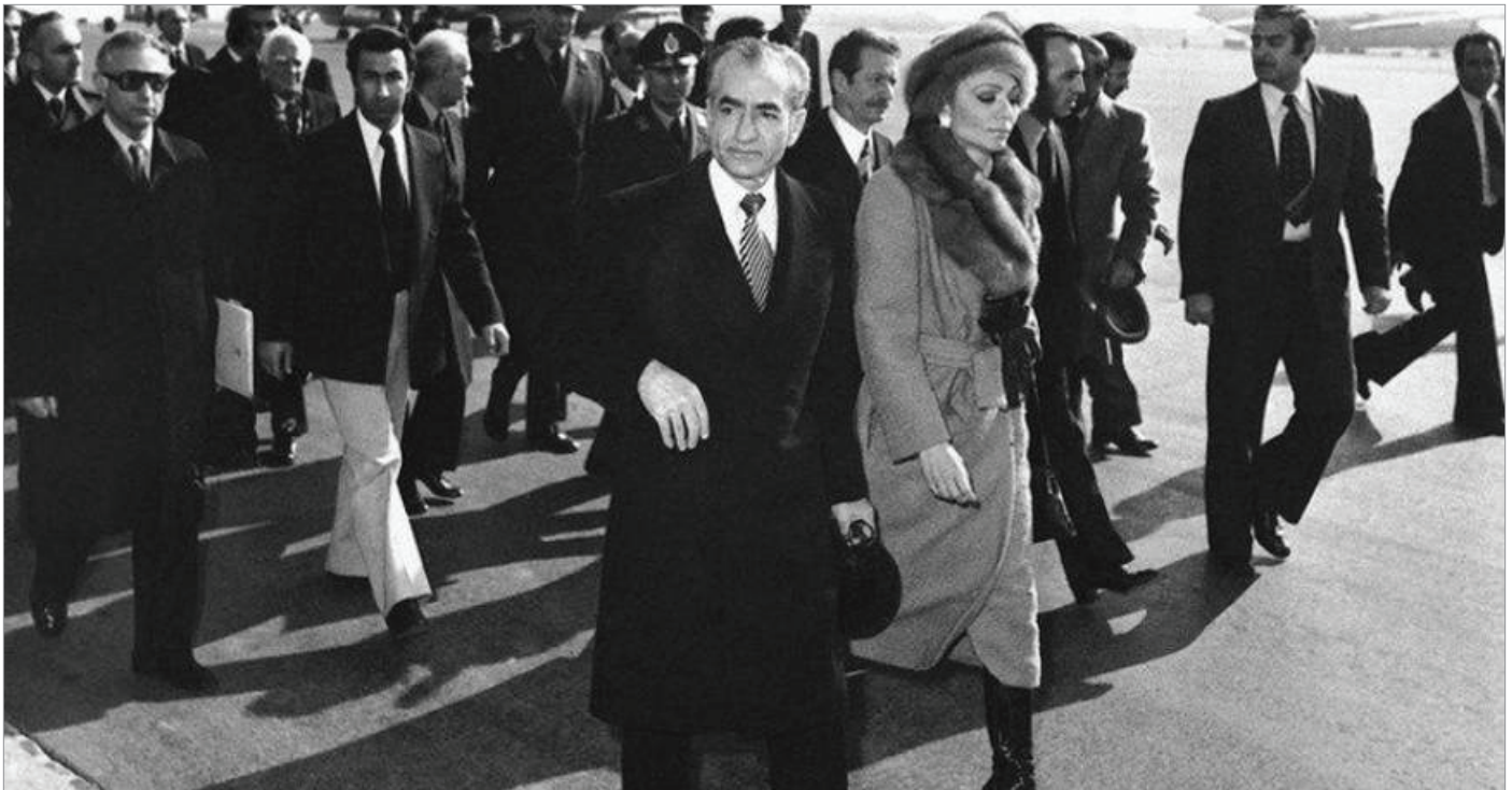
خروج پادشاه فقید و شهبانو از ایران؛ فرودگاه مهرآباد ۲۶/ دی ماه ۱۳۵۷

شرایط را بر جامعه چنان سخت کرده که از دی ماه ۹۶ مردم و حکومت را آشکارتر از همیشه در برابر هم قرار داده است.