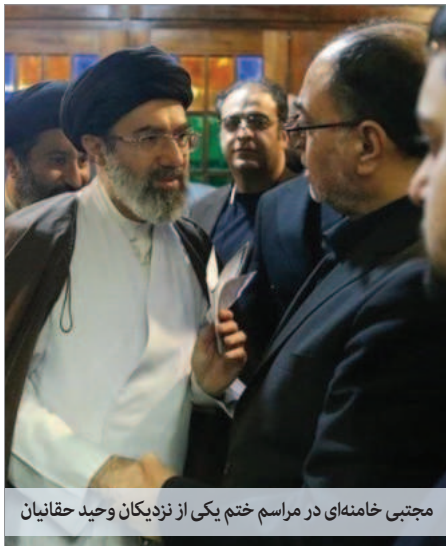
مجتبی خامنه‌ای در مراسم ختم یکی از نزدیکان وحید حقانیان

از نظر امینی، تمرکز روی خامنه‌ای ناشی از نقش محوری او در چشم‌انداز سیاسی ایران است. وی توضیح داده است: «رهبری رکن مهم نظام حاکم بر ایران است، او نیرویی است که آن را از چالش‌های پیچیده هدایت می‌کند و جناح‌های مختلف را در عرصه سیاسی متحد می‌کند. به این ترتیب،