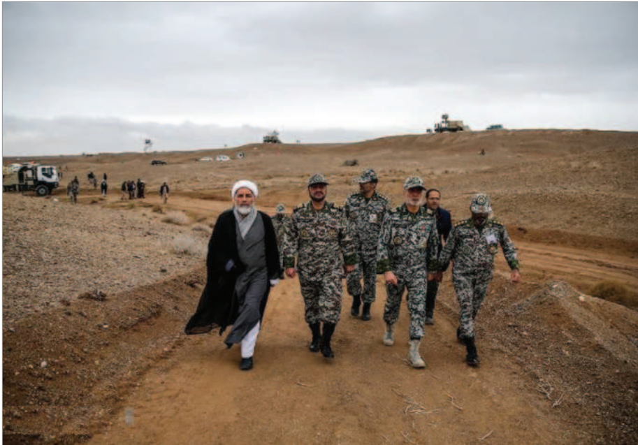
بازدید از سایت‌های پدافندی ارتش در کویر مرکزی ایران

اسد به او پیشنهاد استفاده از مپ‌های بشکه‌ای و تسلیحات شیمیایی هم دادند اما در نهایت پس از فقط چند سال استمرار پر از دلپره نتیجه‌ای نداشت و او سقوط کرد و به مسکو پناه برد.