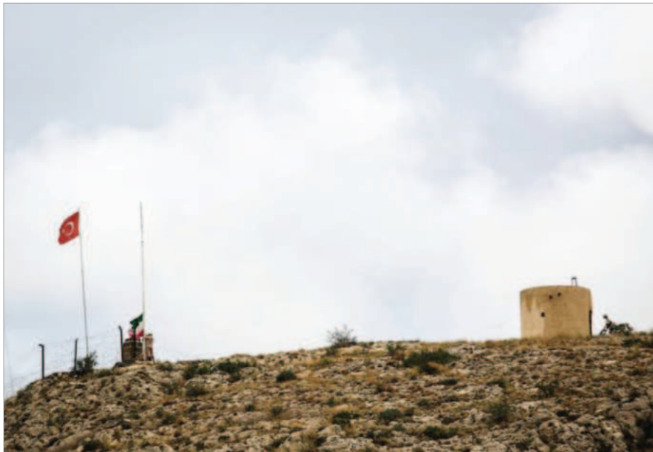
برجک مرزبانی در مرز بازرگان

ژئوپلیتیک ایران را نشان می‌دهد. ترکیه و آذربایجان به دنبال آن هستند که از طریق این کریدور، نفوذ خود را در منطقه قفقاز افزایش دهند و به تدریج دسترسی ایران به این مناطق را محدود کنند. این امر به افزایش تنش‌های سیاسی و دیپلماتیک بین جمهوری اسلامی، ترکیه و جمهوری آذربایجان منجر شده و زمینه‌ساز رقابت‌های شدیدی در منطقه می‌شود.