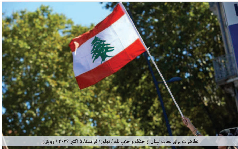
تظاهرات برای نجات لبنان از جنگ و حزب‌الله / تولوز، فرانسه / ۵ اکتبر ۲۰۲۴

● اکنون این جنگ آخر که اتفاق افتاد، آخرین جنگ با اسرائیل دست‌کم از طریق لبنان خواهد بود. در شرایط جدید، شاهد تحولات بیشتری خواهیم بود و چشم‌اندازهای بسیاری به سوی امیدهای بزرگ گشوده خواهد شد. در این میان، برخی از لبنانی‌ها درباره نیاز کشورشان به چیزی فراتر از توافق آتش‌بس با اسرائیل صحبت می‌کنند. آنها اکنون به یک توافق دائمی با ضمانت‌های بین‌المللی برای جلوگیری از بازگشت هر جنگی تحت عنوان «مقاومت» می‌اندیشند.