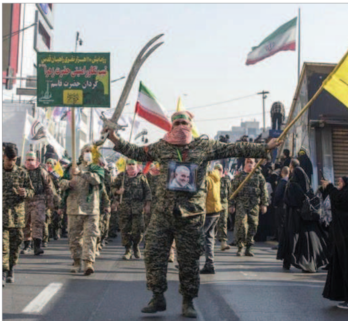
سپاهی‌ها شمشیر بدست وسط خیابان‌ها جولان می‌دهند / رزمایش «راهیان قدس» دی‌ماه ۱۴۰۳