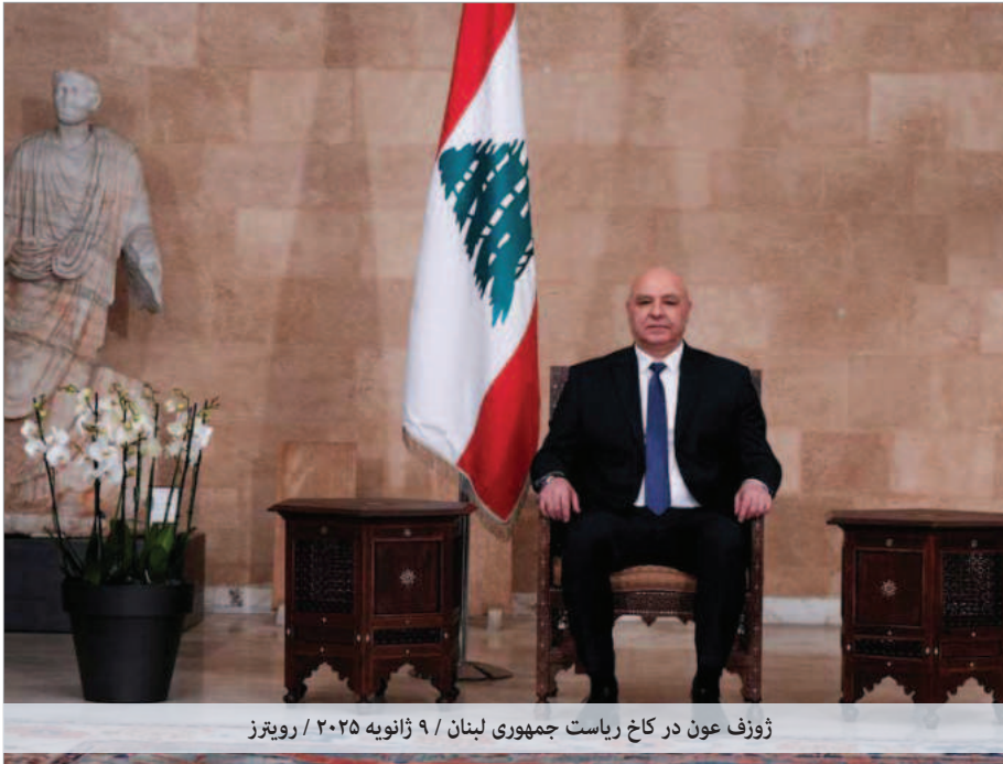
ژوزف عون در کاخ ریاست جمهوری لبنان / ۹ ژانویه ۲۰۲۵

بازسازی اقتصادی کشور غیرممکن است.» ژوزف عون رئیس جمهور منتخب لبنان در اولین سخنرانی اش، البته بدون اشاره مستقیم به حزب الله، گفت «تمام تلاش خود را به کار خواهیم گرفت که دولت حق انحصاری حمل سلاح را در این کشور داشته باشد.» از سال ۲۰۰۶ میلادی و تصویب قطعنامه ۱۷۰۱ شورای امنیت سازمان ملل متحد، حزب الله باید سلاح‌های خود را به دولت تحویل دهد، امری که هرگز عملی نشد. این قطعنامه که به اتفاق آرا توسط شورای امنیت سازمان ملل متحد در ۱۱ اوت ۲۰۰۶ تصویب شد، از سوی دولت وقت لبنان نیز در ۱۲ اوت ۲۰۰۶ به اتفاق آرا تصویب شده بود. از آن سال تا حمله اخیر اسرائیل به لبنان، نیروهای حزب الله نه تنها در مرز با اسرائیل حضور داشتند، بلکه توانایی تسلیحاتی خود را به صورت قابل توجهی افزایش داده بودند. حدش زده می‌شد که این گروه تحت حمایت جمهوری اسلامی بین ۱۲۰ تا ۲۰۰ هزار موشک در جنوب لبنان انبار کرده است، که البته بسیاری از آنها، حدود ۸۰ درصد، در حملات اخیر اسرائیل نابود شدند.