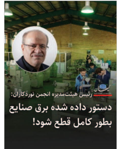
رئیس هیئت‌مدیره انجمن نوردکاران: دستور داده شده برق صنایع بطور کامل قطع شود!

وی با بیان اینکه ناترازی‌ها سود واحدهای تولیدی را می‌بلعد، گفته «تعمیل این تعطیلی‌ها علاوه بر تعطیلات رسمی، آن‌هم به دلیل ناترازی‌ها سود یک‌ساله واحدهای تولیدی را از بین می‌برد و عملاً زیان انباشته ایجاد می‌کند.»