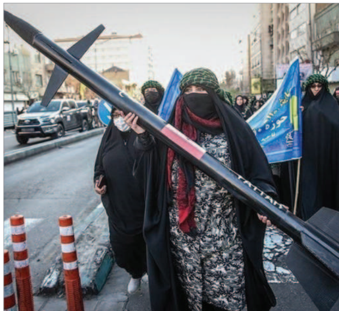
زن چادر به سر انقلابی موشک به دست حوالی دانشگاه تهران

«ما یک نظام معتبر و مقتدر رسمی هستیم و حساب خودمان را با دشمنان براساس توانمندی‌های خودمان انجام می‌دهیم؛ بعد از جسارت‌های اسرائیل، می‌توانستیم به بازوان در منطقه خود بگویم که پاسخ اسرائیل را بدهند اما موشکی از سوریه و لبنان به اسرائیل شلیک نکردیم و خودمان انجام دادیم.»