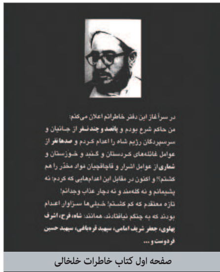
صفحه اول کتاب خاطرات خلخالی

خلخالی افزود: با مطالعاتی که شد، دو تن از تیرباران شدگان و ۱۶ نفر از افراد طالبانی، با اسلحه، مهمات و نارنجک به پاهو حمله کردند و محاکمه آنها، به طور صحرایی