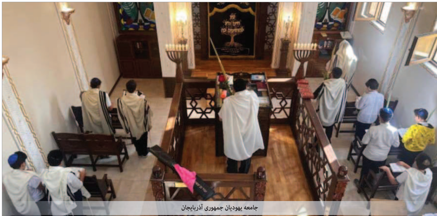
جامعه یهودیان جمهوری آذربایجان

این رویداد یادآور ترور خاخام زوی کوگان در امارات متحده عربی در سال ۲۰۲۴ است که انجام آن به یک سلول تروریستی از پاکستانی نسبت داده شده و گفته می‌شود این سلول ترور تحت هدایت حکومت ایران فعالیت می‌کرده است.