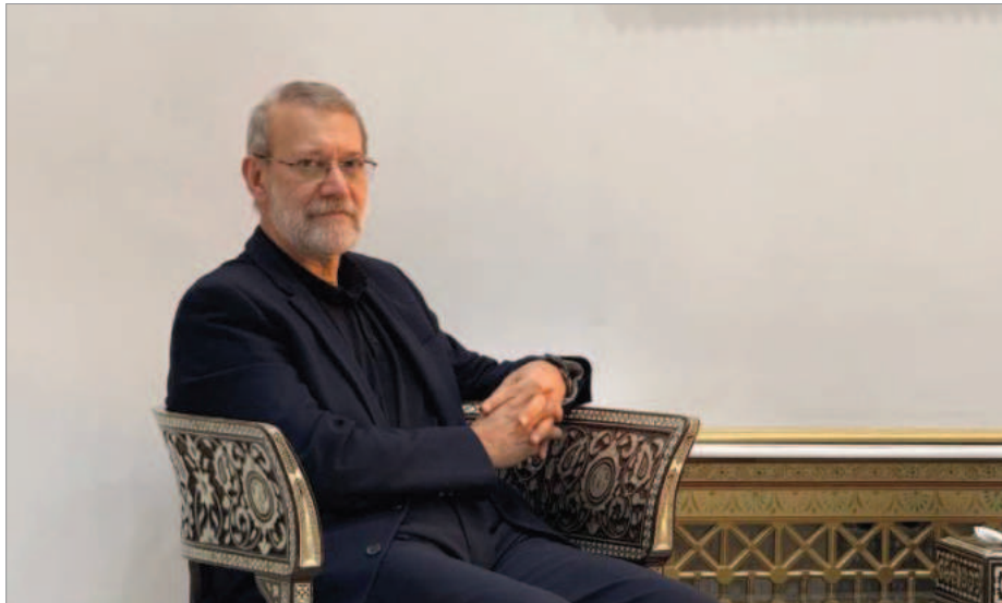
علی لاریجانی عضو مجمع تشخیص مصلحت نظام

آژانس‌های اطلاعاتی غربی شده زیرا می‌ترسند مسکو در ازای دریافت موشک‌های بالستیک برای استفاده در جنگ علیه اوکراین به پیشبرد برنامه‌های اتمی جمهوری اسلامی کمک کند. علی لاریجانی پس از کشته شدن سیدابراهیم رئیسی در سانحه سقوط مشکوک هلی‌کوپتر و روی کار آمدن مسعود پزشکیان بار دیگر به صحنه سیاسی بازگردانده شد. او اخیراً به دلیل گرانی‌ها و افزایش قیمت ارز از دولت پزشکیان انتقاد کرده است.