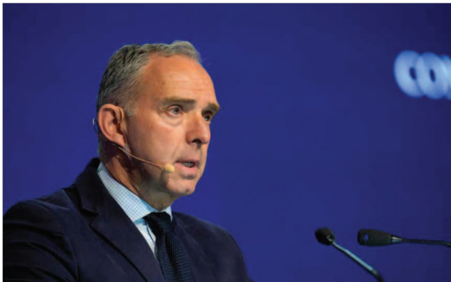
لرد مارک سدویل مشاور پیشین امنیت ملی دولت بریتانیا/ ۱۲ ژوئن ۲۰۲۲

سدویل توضیح داده که بریتانیا با حمایت از سیاست فشار حداکثری اقتصادی علیه حکومت ایران که احتمالاً از سوی دولت ترامپ اعمال خواهد شد، می‌بایست نقش رهبری خود را علیه رژیم ایران نشان دهد.