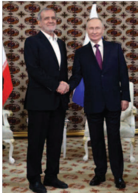
دیدار ولادیمیر پوتین رئیس جمهور روسیه با مسعود پزشکیان در عشق آباد/ ترکمنستان / اکتبر ۲۰۲۴

او همچنین عنوان کرد، نیروهای سپاه هزار قبضه سلاح کلاشینکف از روسیه خواستند تا یکی از خطوط را حفظ کنند اما روس‌ها دریغ کردند و پس از آنهم اسرائیل از ورود هواپیماهای حامل تسلیحات جمهوری اسلامی جلوگیری کرد.