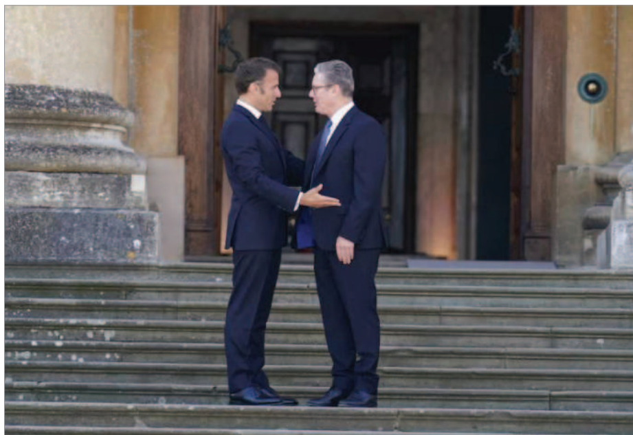
امانوئل ماکرون رئیس‌جمهور فرانسه و کی‌یر استارمر نخست‌وزیر بریتانیا

او تأکید کرد: «اصل مذاکره با دولت‌های غربی اشکالی ندارد، اما اگر قرار بود که از اینگونه مذاکرات به نتیجه برسیم، باید در همان مرتبه‌های قبلی چنین نتیجه‌ای حاصل می‌شد.»