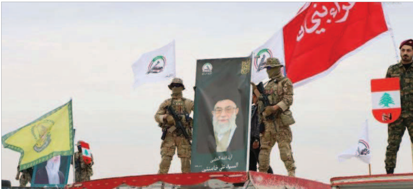
پس از فشارهای دولت عراق برای انحلال حشد الشعبی، تعدادی از اعضای این سازمان بر روی رود شط العرب در بصره حاضر شدند

کرده که گزارش‌های پیش از این دیدار حاکی از آن بود که هدف از سفر نخست وزیر عراق به تهران اتفاقاً بررسی «نحوه انحلال و ادغام برخی گروه‌های مسلح در چارچوب سازمان حشد الشعبی» بوده است.