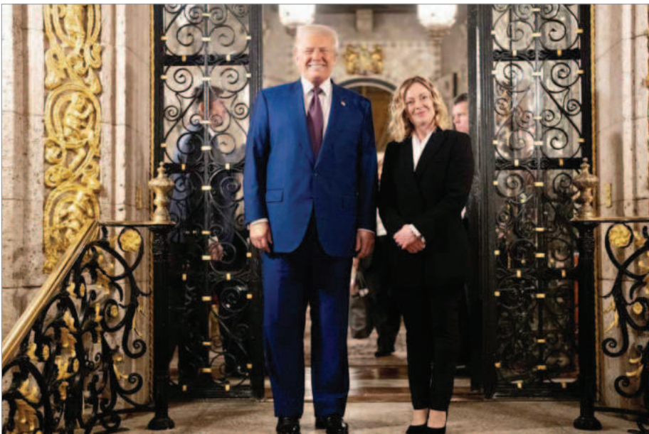
جورجیا ملونی نخست وزیر ایتالیا و دونالد ترامپ رئیس جمهور منتخب آمریکا در ماراگو / فلوریدا / ۴ ژانویه ۲۰۲۵

هیچکدام از این دو اتهامی که آمریکا به محمد عابدینی نجف آبادی وارد کرده، نمی‌توانستند دلیل کافی برای استرداد او به ایالات متحده باشند.