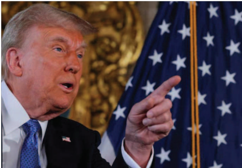
دونالد ترامپ

مردم ایران نیز حمایت کند. سازمان «اتحاد علیه ایران هسته‌ای» همچنین توصیه کرده است برای ریزش نیروهای نظامی و تشویق مهره‌های اصلی رژیم از جمله اعضای سپاه، بسیج و نهادهای امنیتی برنامه‌ریزی شود. افزایش تحریم‌های اقتصادی، نظارت بر شبکه‌های مالی، مقابله با باندهای پولشویی و نظارت بر اجرای تحریم‌ها از دیگر پیشنهادات این سازمان به دولت ترامپ است. در این بخش توصیه شده که مدل مقابله با الیگارش‌های روس پس از جنگ اوکراین را می‌توان در مورد باندهای مالی جمهوری اسلامی به اجرا درآورد. «ایجاد صندوق برای کمک به مردم ایران» با استفاده از کمک‌های مالی غربی و همچنین محل دارایی‌های مسدود شده ایران پیشنهاد دیگر این سازمان به دولت جدید آمریکا است. همچنین از ترامپ خواسته شده نظارت‌های دریایی و کنترل و مقابله با شبکه کشتیرانی وابسته به رژیم ایران را به عنوان اصلی‌ترین ابزار برای دور زدن تحریم‌ها افزایش دهد. در همین ارتباط تأکید شده است که یکی از این محدودیت‌ها اجرای تحریم‌ها بر بنداری است که میزبان کشتی‌ها و محموله‌های جمهوری اسلامی هستند. سازمان «اتحاد علیه ایران هسته‌ای» خواستار ایجاد کمپین حمایت از «ملوانان و کاپیتان‌های ریزشی» و همچنین حمایت از کمک به درز دادن اطلاعات برای لو رفتن این شبکه‌ها شده است. مارک دی والاس مدیر و بنیانگذار سازمان «اتحاد علیه ایران هسته‌ای» در اینبار به فاکس نیوز گفت: «ترامپ اکنون این فرصت منحصر به فرد را دارد تا جمهوری اسلامی را در شرایطی که به شدت تضعیف شده، به عقب براند.» او افزود که رئیس‌جمهور منتخب «با استفاده از ابزارهای دیپلماتیک، اطلاعاتی، نظامی و اقتصادی برای پاسخگو کردن تهران، می‌تواند ثبات منطقه و خاورمیانه جدید را ارتقاء دهد.»